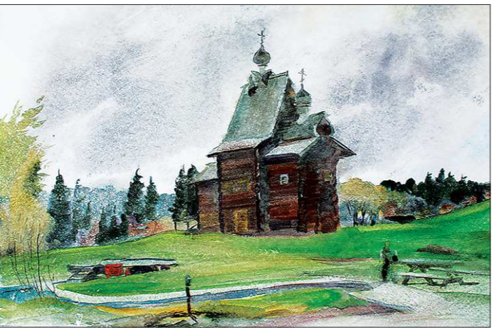
Василий Краснорободкин. «Хохловка. Осенний день» (акварель)