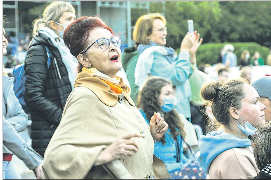
Сейчас находиться без маски можно только на небольших массовых мероприятиях на свежем воздухе

Спортивных мероприятий из-за сложности соблюдения социальной дистанции в рамках Месячника пенсионера в этом году нет. Некоторые мероприятия, лекции и мастер-классы перевели в онлайн-формат, чтобы не подвергать людей пожилого возраста лишнему риску заражения новым коронавирусом, но часть Месячника пенсионера пройдёт в привычном живом, а не виртуальном формате. Однако организаторы всех очных мероприятий предупреждают: для посещения необходима предварительная запись по указанному номеру телефона, наличие пенсионного удостоверения и средств индивидуальной защиты.