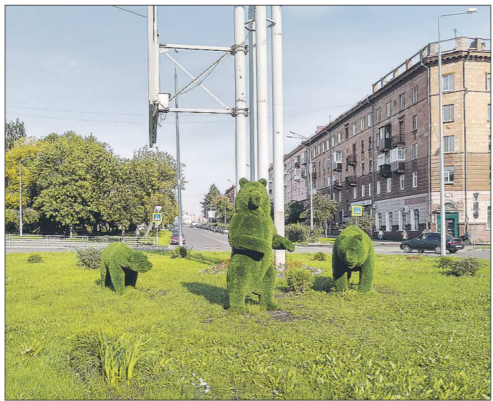
В Нижнем Тагиле недавно установили фигуры трёх медведей, а на окраинах города замечены их прототипы

Летом мамы-медведицы отпускают в самостоятельную жизнь «подростков» двух-трёх лет. Молодые животные ищут свободные кормовые площадки. У каждого зверя индивидуальная территория обитания –