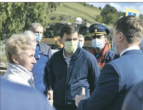
Евгений Куйвашев после паводка несколько раз приезжал в Нижние Серги. В этот раз он проверил, как исполняются поручения по восстановлению города

Подготовлено в соответствии с критериями, утверждёнными приказом Департамента информационной политики Свердловской области от 09.01.2018 №1 - Об утверждении критериев отнесения информационных материалов, публикуемых государственными учреждениями Свердловской области, в отношении которых функции и полномочия учредителя осуществляет Департамент информационной политики Свердловской области, к социально значимой информации».