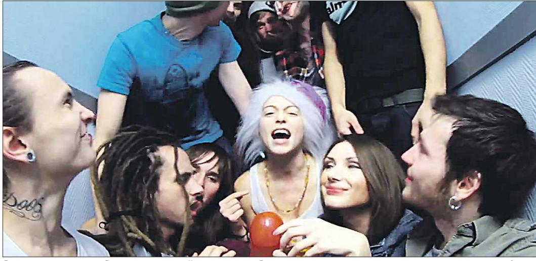
Создатели клипа «Зачем ты под чёрного легла?», судя по их внешнему виду, никак не могут быть единомышленниками националистов

— Я считаю, что это абсурд — привлекать к ответственности в подобном рода ситуациях, — рассказал «Областной» президент Урало-Сибирской колле-