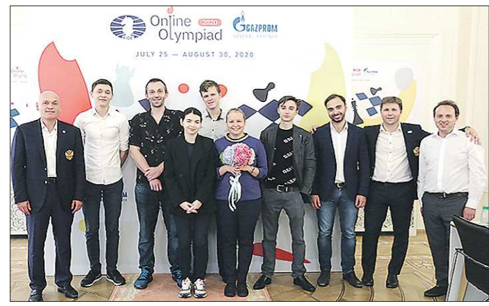
Победное фото сборной России