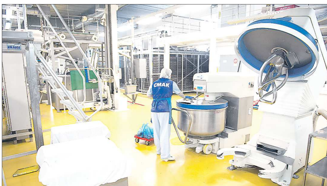
Пожар произошёл в цехе, где производят булочки. По понятным причинам в ближайшие дни их может не быть

В минувший понедельник на хлебокомбинате «СМАК» в Екатеринбурге произошёл пожар, площадь которого оценивается в 800 квадратных метров.