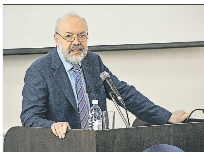
Павел Крашенинников рассказал студентам о том, какие изменения могут появиться в законодательстве из-за поправок в Конституцию

Традиционные линейки в свердловских школах в целях безопасности в этом году отменили – для ребят провели патристические классные часы. Поздравить с Днём знаний учеников, родителей и педагогов школы №4 в Арамиле приехал