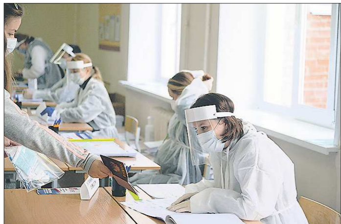
На участках в единый день голосования будут соблюдены все меры санитарно-эпидемиологической безопасности

Специально созданная комиссия пока оценивает объёмы ущерба от пожара. Но уже сейчас понятно, что восстанавливать здание 1930-х годов постройки нецелесообразно.