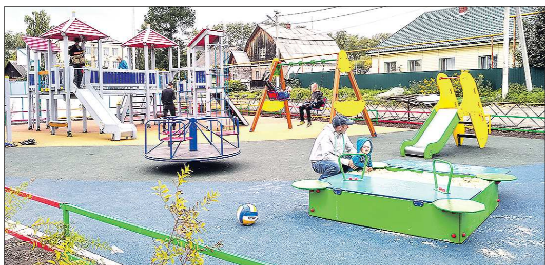
Площадка в Девятом посёлке – вторая в отдалённом микрорайоне. Первая была открыта недавно в посёлке Рудника имени III Интернационала

В Девятом посёлке Нижнего Тагила появилась универсальная досуговая площадка. Здесь можно заниматься спортом, гулять с детьми и даже устраивать концерты.