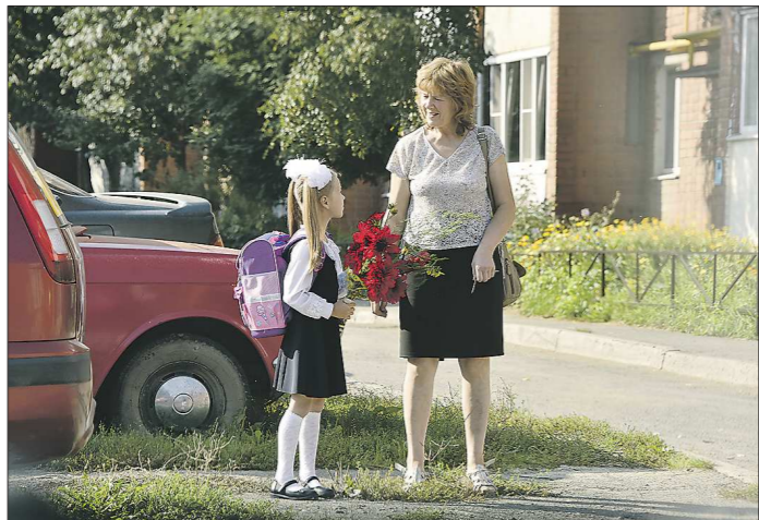
1 сентября 2020 года порадовало школьников и родителей ясной летней погодой с температурой +27 градусов

Здание школы №25 будет доступно для учеников с 1 октября. Почти готова и школа-сад №24 в посёлке Сосновка Карпинского ГО на 172 места – сдачу планируют в ноябре 2020 года. После капитального ремонта открыли двери школы №43, №49 и №81 в Екатеринбурге, школа №7 в Североуральске и школа №13 в посёлке городского типа Дружинино.