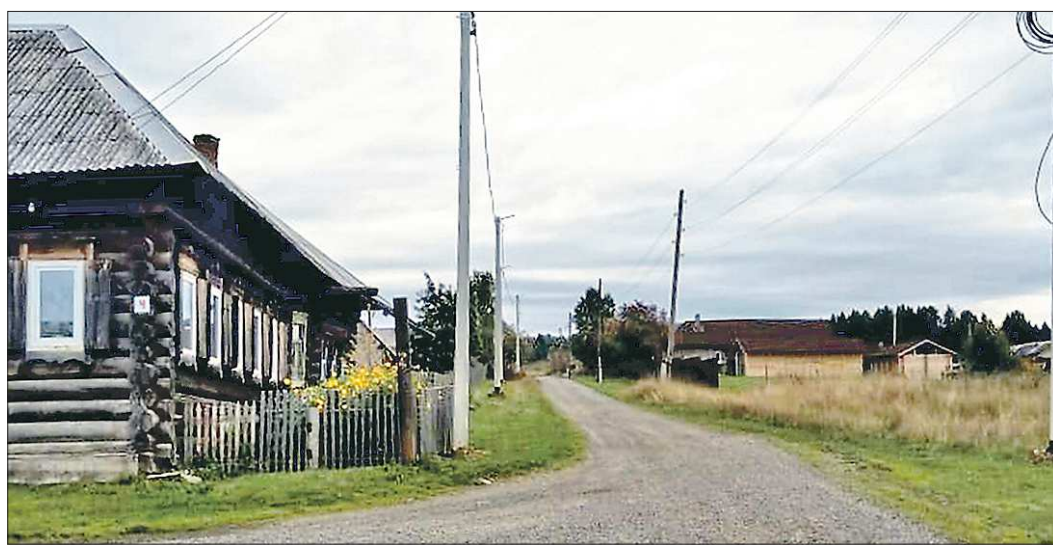
Теперь село Сулём освещают 92 фонаря – по полтора на каждого прописанного жителя

Подготовлено в соответствии с критериями, утвержденными приказом Департамента информационной политики Свердловской области от 09.01.2018 №1 «Об утверждении критериев отнесения информационных материалов, публикуемых государственными учреждениями Свердловской области, в отношении которых функции и полномочия учредителя осуществляет Департамент информационной политики Свердловской области, к социально значимой информации».