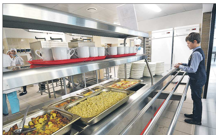
«В школах должны быть комфортные столовые и буфеты, чтобы обеспечить детей горячим питанием», - сказал Президент РФ

● МЛАДШИЕ КЛАССЫ ОБЕСПЕЧАТ ГОРЯЧИМ ПИТАНИЕМ. Учащимся начальных классов общеобразовательных школ гарантированы горячее питание и напитки во время учёбы – с первого сентября вступают в силу поправки в федеральный закон об образовании. Субсидии на организацию питания субъектов РФ будут получать из федеральной казны. Обеспечить бесплатным горячим питанием школьников поручил Президент России Владимир Путин 11 августа на совеща-