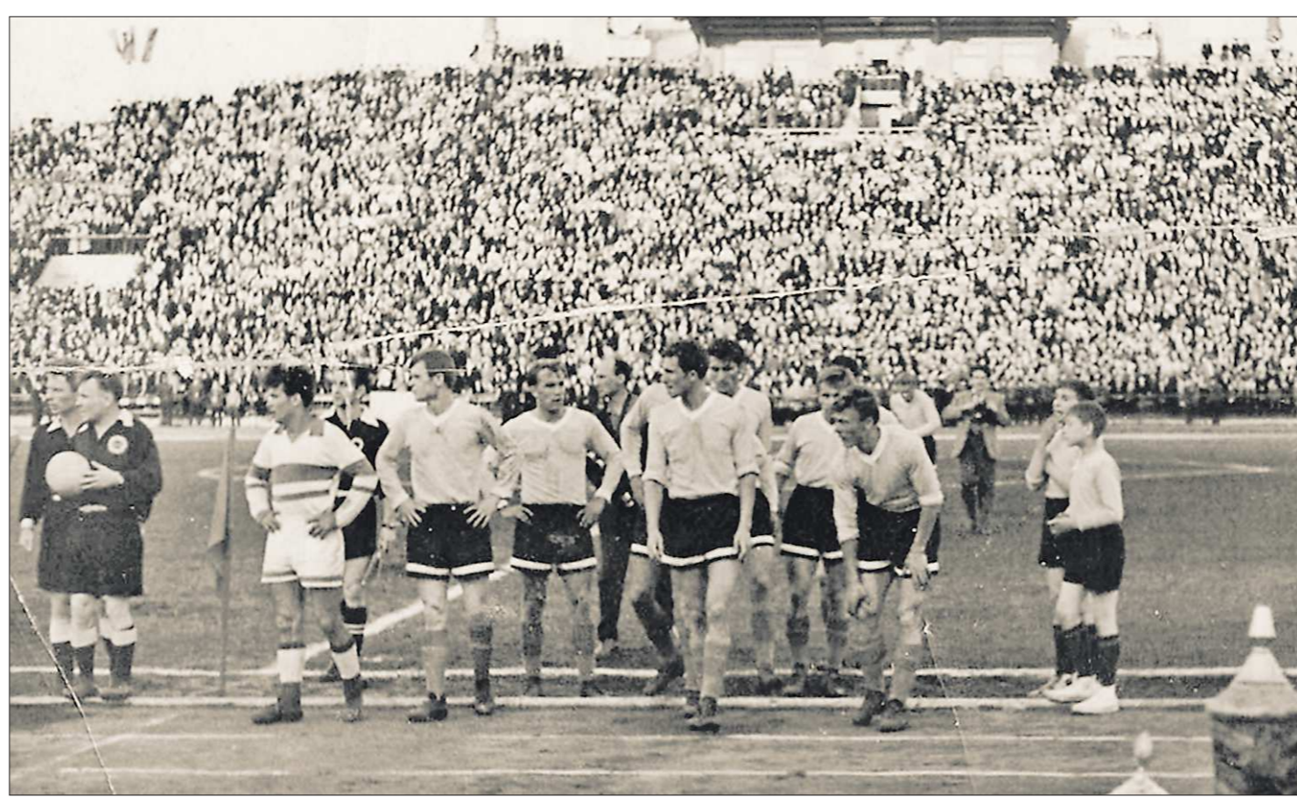
Одна из самых ярких страниц в 90-летней истории футбольного «Урала» («Уралмаш») - выступление команды в элитной лиге чемпионата СССР в 1969 году. Пожалуй, самое сильное впечатление на этом фото производят заполненные до отказа трибуны Центрального стадиона Свердловска