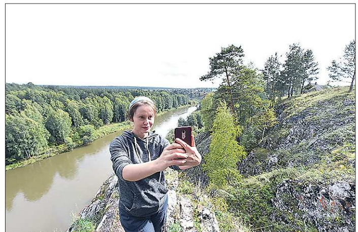
Ну как не запечатлеть себя на фоне такой красоты!

новый мох мы пристраивали поблизости от старой уцелевшей деревни, пенёк, – рассказывает Евгений Скворцов. – Вокруг всё должно оставаться, как было до прихода сюда человека.