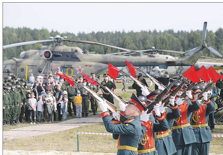
На открытии форума показательное выступление провели солдаты роты Почётного караула ЦВО