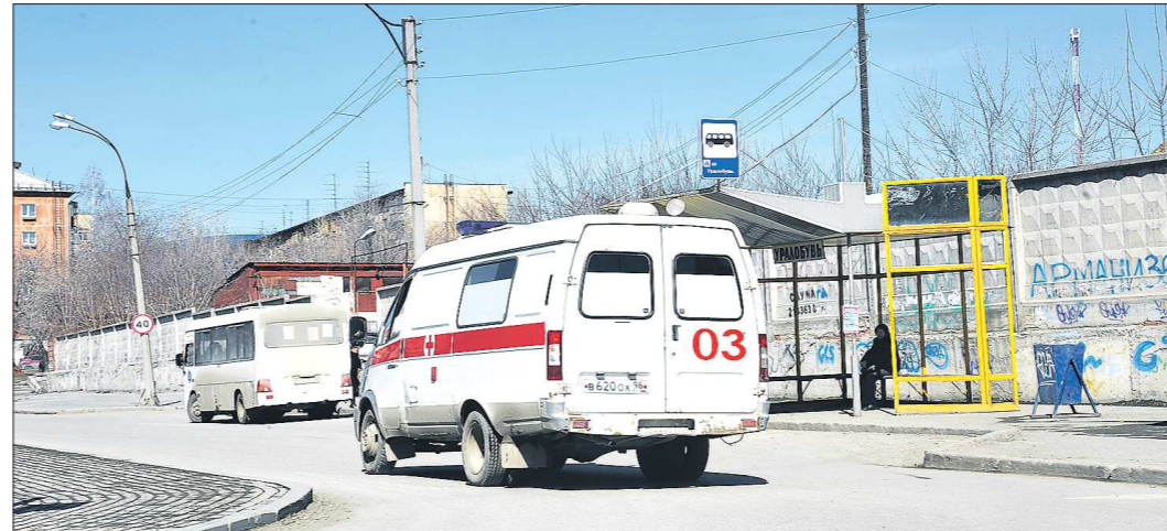
В Двуреченске только одна машина скорой на весь посёлок, но руководство Сысертской ЦРБ говорит, что всё в соответствии с приказом Минздрава России

После того как вице-премьер России Татьяна Голкова признала, что оптимизация здравоохранения в стране прошла ужасно (см. «ОГ» №239 от 26.12.2019), в России заговорили о необходимости восстановления медицины во всех посёлках и деревнях.