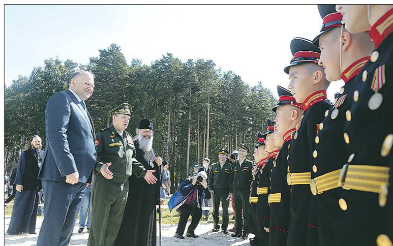
Почётные гости (слева направо): полпред Президента России в УрФО Николай Цуканов, командующий войсками ЦВО Александр Лапин, митрополит Екатеринбургский и Верхотурский Кирилл встретились на форуме с самыми юными его участниками – воспитанниками Екатеринбургского СВУ