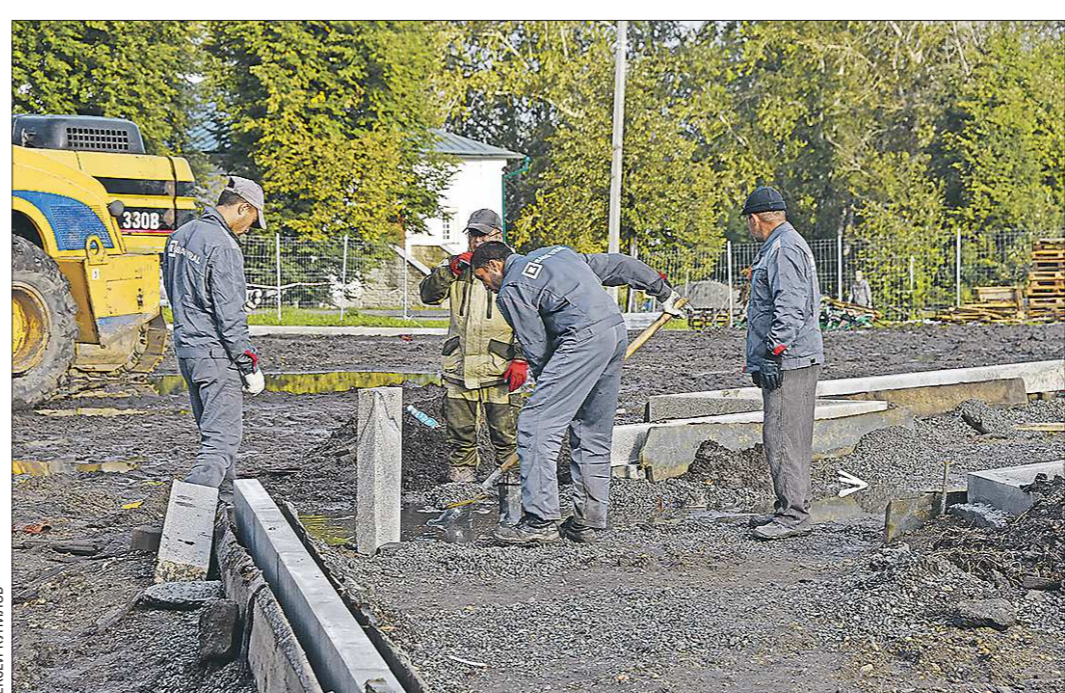
Ремонт дорог в сельских территориях случается часто, поэтому становится событием для жителей

Подготовлено в соответствии с критериями, утверждёнными приказом Департамента информационной политики Свердловской области от 09.01.2018 №1 «Об утверждении критериев отнесения информационных материалов, публикуемых государственными учреждениями Свердловской области, в отношении которых функция и полномочия учредителя осуществляет Департамент информационной политики Свердловской области, к социально значимой информации».