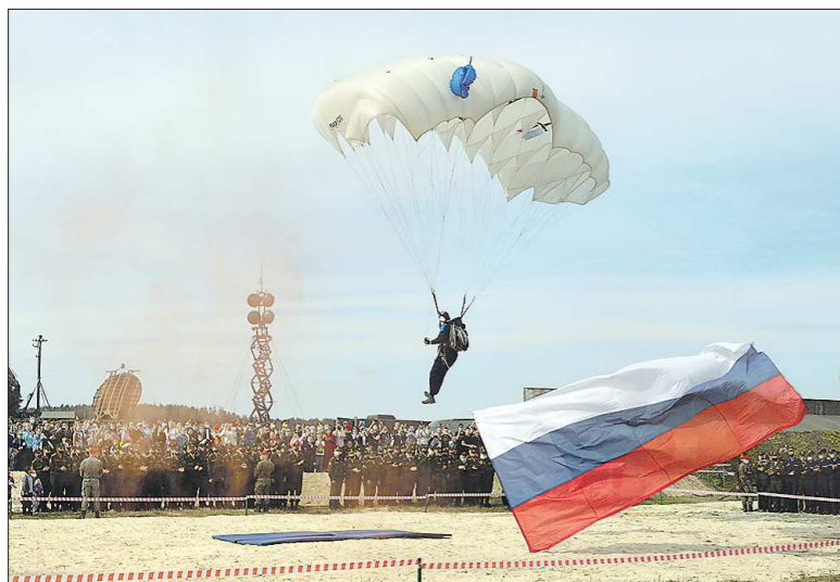
Высокое мастерство показали гостям форума десантники-парашютисты, один за другим приземлившись на обозначенный им пяткачок