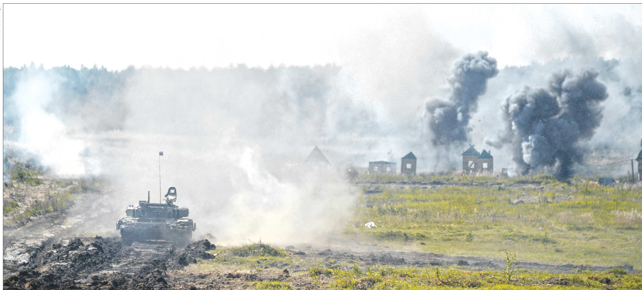
Вчера в Екатеринбурге, на общевойсковом полигоне «Свердловский» Центрального военного округа, стартовал региональный этап VI Международного военно-технического форума «Армия 2020». Он продлится три дня. Его самый зрелищный элемент – учебные бои танковых и мотострелковых подразделений ЦВО. «Бои» проходят при поддержке ударных ударных подразделений армейской авиации