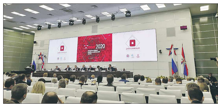
Одной из тем форума «Армия-2020» стала диверсификация ОПК

Китай намерен быть участником и движущей силой процесса реформы системы глобального управления, способствовать развитию международного порядка в более справедливом и рациональном направлении, твёрдо придерживаться сотрудничества с другими странами для создания нового пути мирного развития и всеобщего выигрыша. Китай готов совместно с международным сообществом продвигать строительство международного отношений нового типа, совершенствовать систему глобального управления, способствовать миру, стабильности и процветанию во всём мире, чтобы воплотить в жизнь прекрасное видение Сообщества единой судьбы человечества.