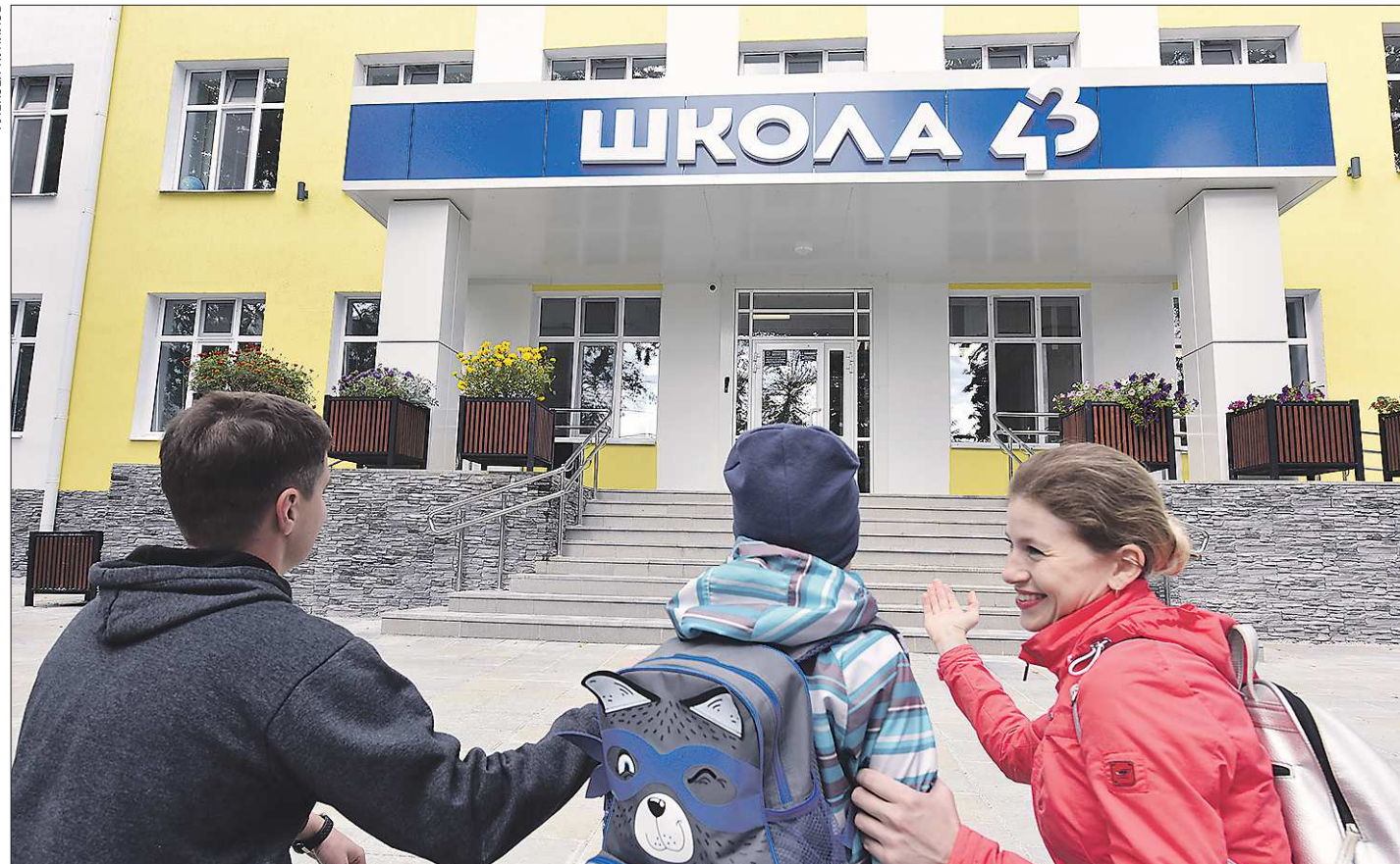
Вчера, 25 августа, в Свердловской области прошёл региональный августовский педсовет, посвящённый новому учебному году в школах. Он начнётся, как обычно, 1 сентября в очном формате и без масок (их ношение обязательно только для работников столовых). А вот в вузах области ситуация не такая оптимистичная...