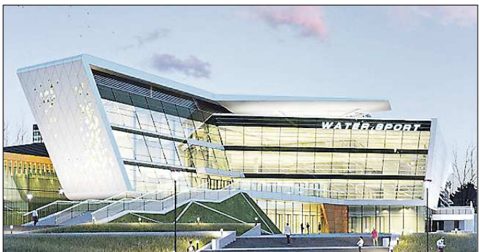
Дворец водных видов спорта станет самым дорогим объектом Универсиады, за исключением «Арены УГМК», которая будет построена за счёт внебюджетных средств

Солідные суммы выделят и на реконструкцию уже существующих спортивных объектов на территории Свердловской области, которые будут задействованы в проведении соревнований. Так, Дворец водных видов спорта в Первоуральске реконструируют за миллиард