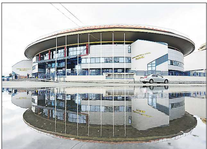
На капитальный ремонт ДИВСа потратят миллиард рублей

рублей, на реконструкцию легкоатлетического стадиона «Калининец» предусмотрено 40 миллионов рублей. На адаптацию «Екатеринбург Арены» к Универсиаде-2023 выделят 550 миллионов рублей, большая часть средств пойдёт на демонтаж временных трибун, построенных к чемпионату мира по футболу. Напомним, что проект адаптации должен быть представлен до конца 2020 года.