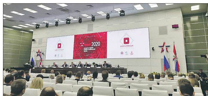
Одной из тем форума «Армия-2020» стала диверсификация ОПК

Китай намерен быть участником и движущей силой процесса реформы системы глобального управления, способствовать развитию международного порядка в более справедливом и рациональном направлении, твёрдо придерживаться сотрудничества с другими странами для создания нового пути мирного развития и всеобщего выигрыша. Китай готов совместно с международным сообществом продвигать строительство международного отношений нового типа, совершенствовать систему глобального управления, способствовать миру, стабильности и процветанию во всём мире, чтобы воплотить в жизнь прекрасное видение Сообщества единой судьбы человечества.