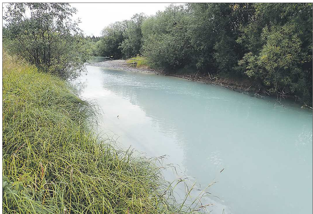
Так выглядит река Шегультан - то синяя, то зелёная

Пробы воды, сделанные летом в северных уральских реках, вновь показали кратное превышение предельно допустимых концентраций (ПДК) разных металлов.