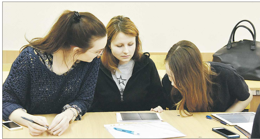
В вузах будут стараться соблюдать требования Роспотребнадзора, но создать социальную дистанцию между студентами невозможно

Пандемия коронавируса внесла большие изменения в образовательный процесс школ и вузов, но уральские университеты начнут обучение студентов с 1 сентября, как и всегда.