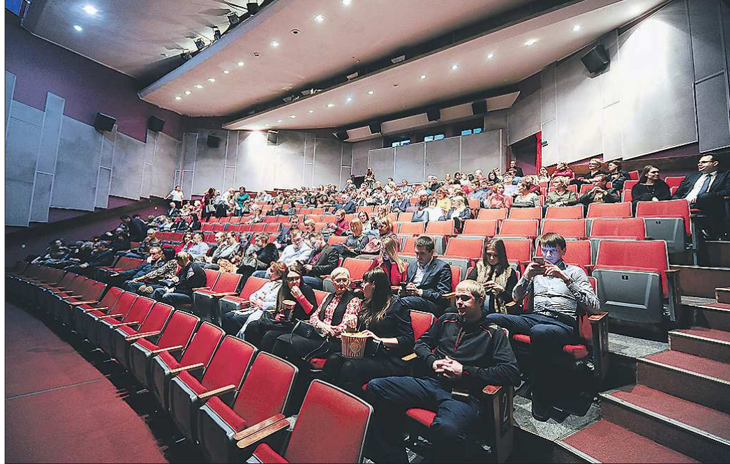
В городах, где уже открыли кинотеатры, билеты продают с учётом дистанции между зрителями не менее одного метра. Члены семьи могут сидеть рядом

Но это, повторюсь, крупные сети. Признать честно, звонить в кинозалы на 100–200 человек в небольших городах и