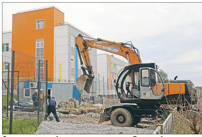
Осенью начнут работу девять новых школ в Екатеринбурге, Невьянске, Арамиле, Ревде и Каменске-Уральском - всего на 7 600 учеников.

Подготовлено в соответствии с критериями, утверждёнными приказом Департамента информационной политики Свердловской области от 09.01.2018 №1