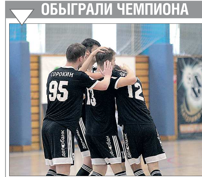
«Синара» вышла вперёд в серии до трёх побед

Подготовлено в соответствии с критериями, утвержденными приказом Департамента информационной политики Свердловской области от 09.01.2018 №1 «Об утверждении критериев отнесения информационных материалов, публикуемых государственными учреждениями Свердловской области, в отношении которых функции и полномочия учредителя осуществляет Департамент информационной политики Свердловской области, к социально значимой информации».