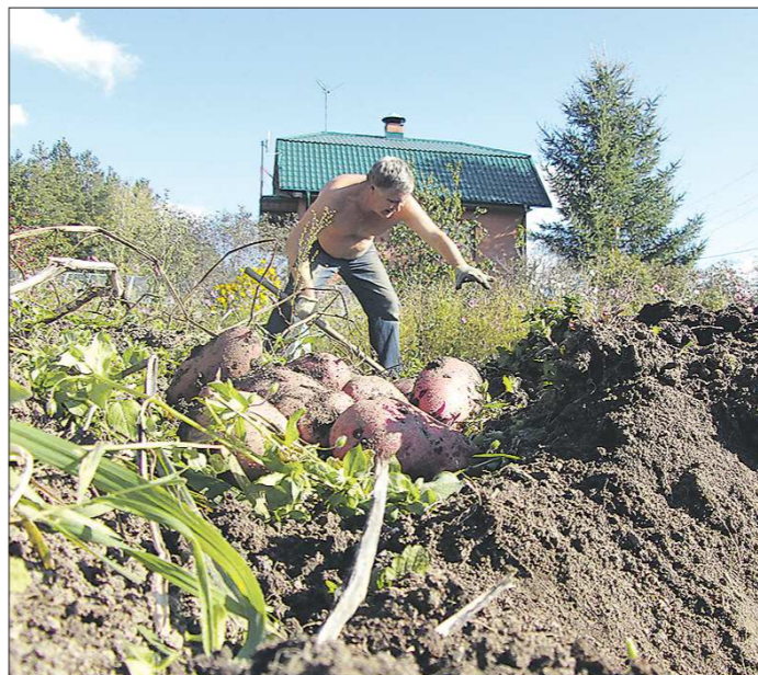
Картошку копают, когда закончится фотосинтез в её ботве

Ещё один признак того, что картошку пора копать – если земля вокруг куста слегка вспучилась. Пора брать за вилы, да-да, именно за вилы, потому что