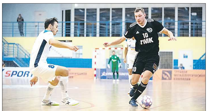
«Синара» и «Газпром-Югра» одержали по две победы в полуфинальной серии