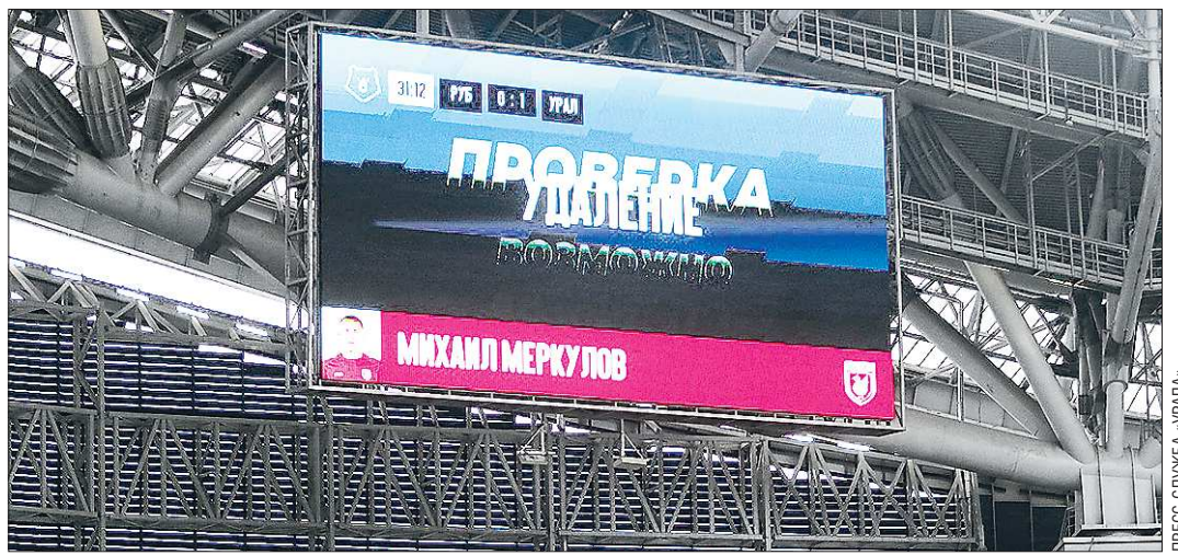
В матче «Рубин» – «Урал» главный арбитр встречи не один раз обращался к видеоповторам

* спортивный разряд в айкидо. Всего их 10