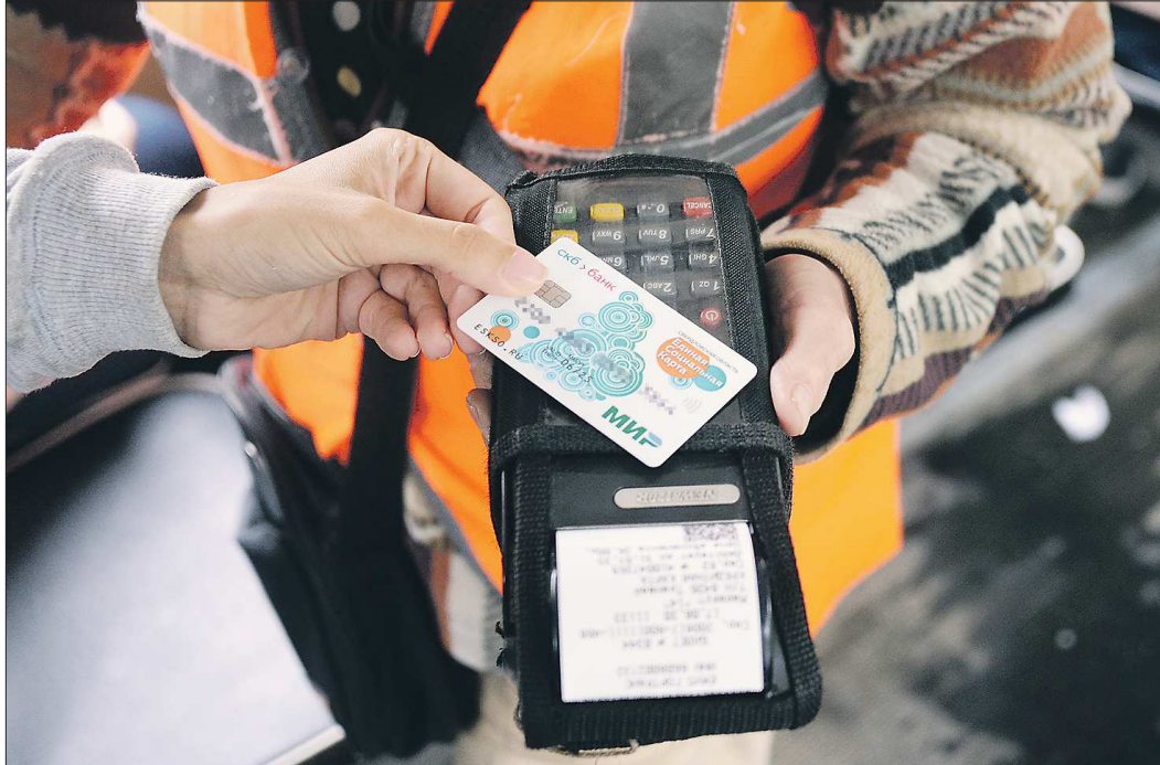
Уже сейчас единой социальной картой можно оплачивать проезд в общественном транспорте