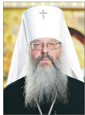
Митрополит Кирилл пояснил, что верующие, осквернившие себя расколом, могут вернуться в лоно церкви

Екатеринбургу и области уже хорошо знаком острый слог митрополита: это обра-