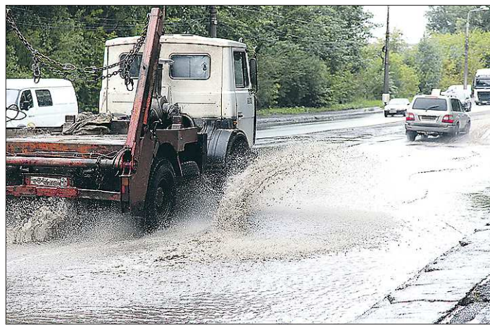
Вот так выглядят сегодня залитые дождями Тагилстрой

Августовские дожди показали, насколько не готовы улицы Нижнего Тагила к отводу воды. На некоторых участках лужи растекаются на десятки метров, и асфальт не успевает прохвнуть до следующего дождя. В адрес мэрии пошли многочисленные жалобы. Глава города Владислав Пинаев, собрав дорожников, объехал проблемные улицы. После этого там появились кюветы.