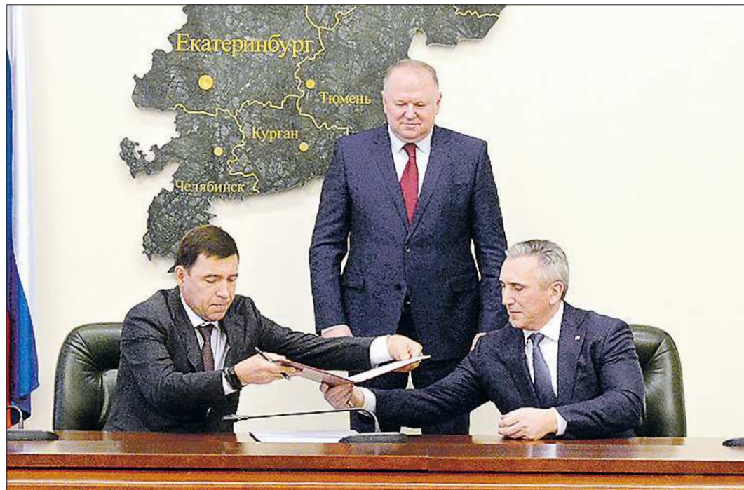
При подписании соглашения между главой Свердловской области Евгением Куйвашевым (слева) и главой Тюменской области Александром Моором присутствовал полпред президента России в УрФО Николай Цуканов (в центре)

В Тугулыме дружба с тюменцами обрела новые перспективы. В муниципалитете работают многие тюменские предприниматели – сейчас совместно с мэрией округа они реализуют два инвестиционных проекта по развитию придорожного сервиса (строительство гостиничных комплексов) на трассе Екатеринбург – Тюмень. В сфере розничной торговли основная доля товара – продукты и стройматериалы – завозится в Тугулым из Тюмени. А тугулымские лесозаготовители вышли на рынок сбыта в Тюменскую область.