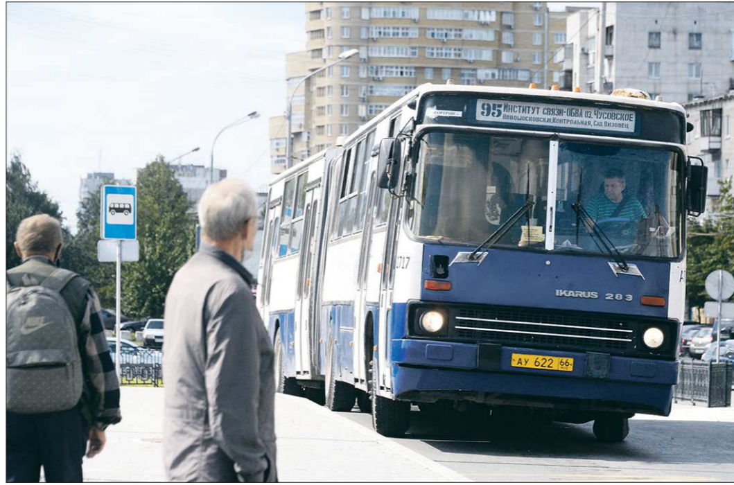
Название марки «Икарус» происходит от имени мифического героя Икара, умеющего летать на самодельных крыльях

В Екатеринбурге до конца года могут списать все автобусы марки «Икарус». Громкое заявление сделал мэр уральской столицы Александр Высокинский на городском телеканале.