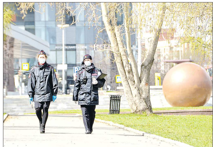
Полицейские рейды стали действенной мерой в борьбе с нарушениями режима самоизоляции

В итоге, как сообщили «Облгазете» в ГУ МВД России по Свердловской области, за время действия режима полной самоизоляции сотрудниками полиции составлено 26 449 административных протоколов и выписано 11 198 постановлений о наложении штрафов на общую сумму 17,2 миллиона рублей. Но не всех нарушителей полицейские штрафовали: со многими из них они проводили разъяснительные беседы – всего правоохранители вынесли гражданам более 3,5 тысячи предупреждений. Супермаркеты и продук-