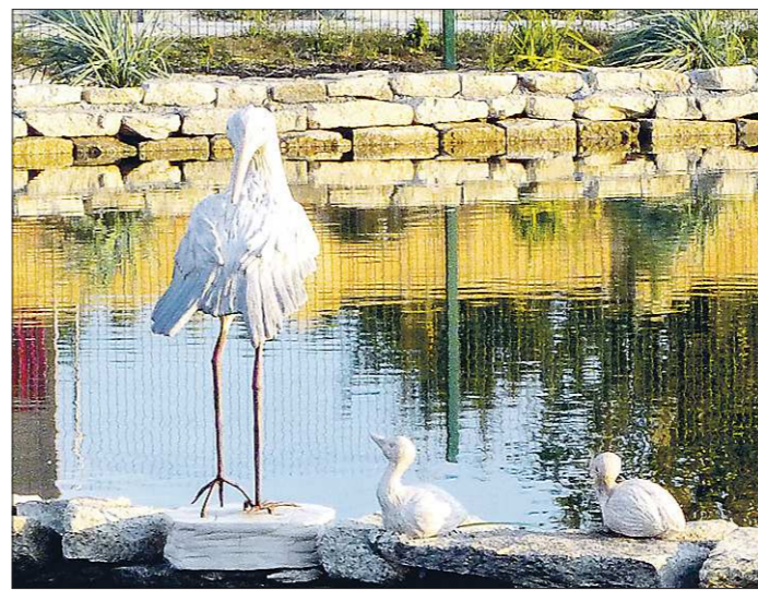
Края водоёма можно украшать разными декоративными фигурами

Чаще всего современные водоёмы, по словам нашего эксперта, делают квадратной или прямоугольной формы. Часто из металла, что делает водоём похожим на садовое «зеркало» из воды. Но важно правильно расположить его: 30-50 процентов водоёма непременно должны быть в тени, а остальная часть – на солнце и отражать небо либо