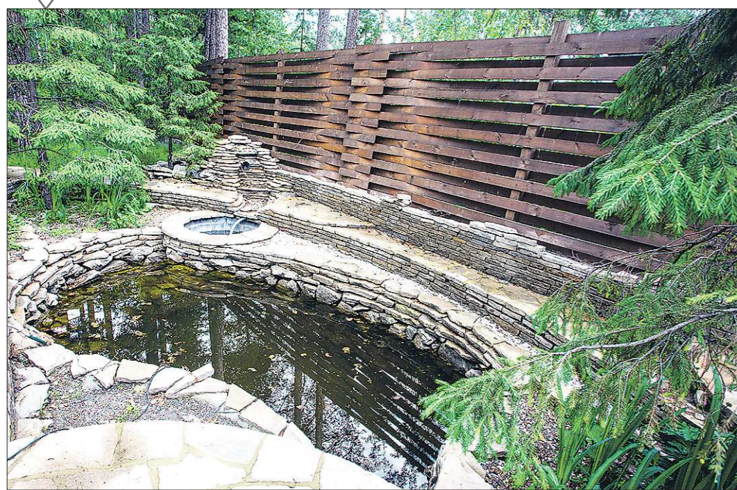
На вашем садовом участке чего-то не хватает? Возможно, вы уже задумывались о водоёме с золотыми рыбками и нимфеями. «Областная газета» готова рассказать, как устроить на садовом участке один из самых красивых и чарующих объектов