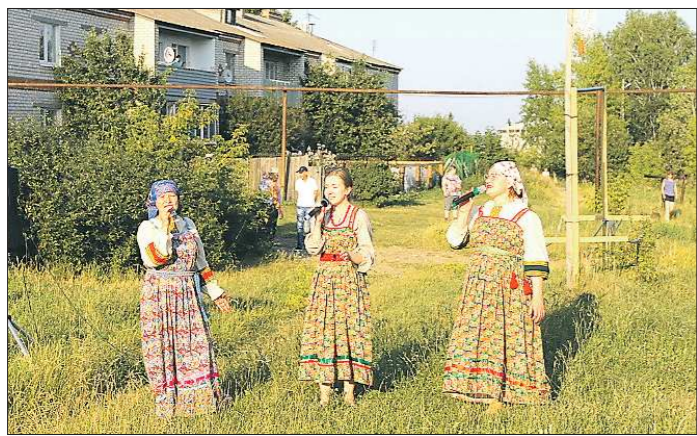
Один из концертов на открытой площадке – зрители аплодировали артистам с балконов и скамеек