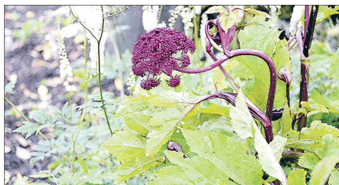
Каждый конкурсный сад содержит какую-то тайну. Например, название и секрет этого растения организаторы фестиваля раскроют только после его открытия

Для нас привычный образ черёмухи – изогнутая, как буд-