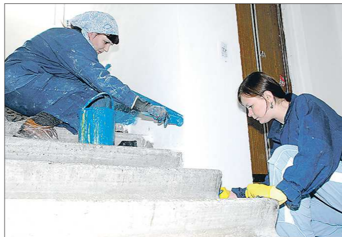
Уральцы, которые потеряли работу из-за пандемии, могут заняться общественными работами и заработать себе на жизнь

Однако субсидии не могут получить работодатели, находящиеся в статусе банкротства, иностранные компании, предприятия, финансирующиеся из государственного или муниципального бюджета. Также льготой не пользуются воспользоваться тем, чья деятельность временно приостановлена из-за коронавируса