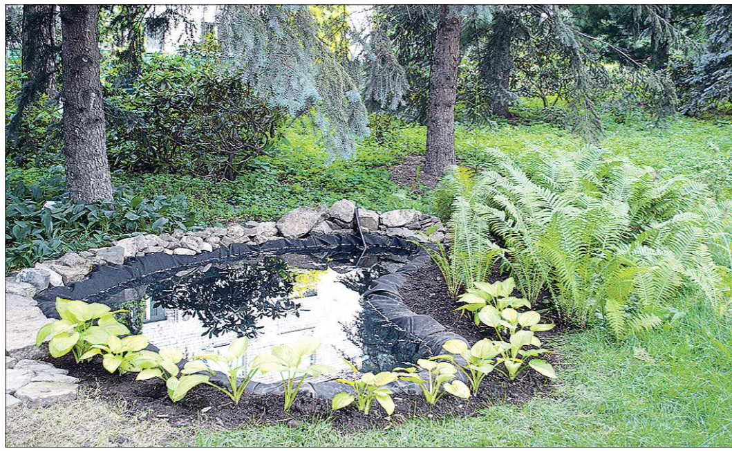
Лучше всего, когда в водоёме на садовом участке отражается растущая вокруг зелень

Если в водоёме на дачном участке будет обитать съедобная рыба, то её можно выловить за летний сезон. Декоративные рыбы остаются в водоёме на зиму, поэтому важно делать его глубиной не менее