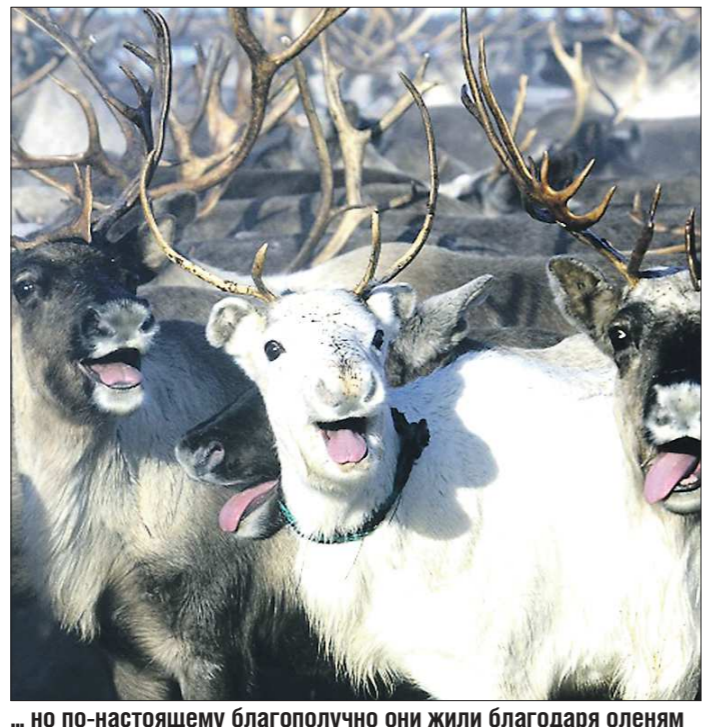
... но по-настоящему благополучно они жили благодаря оленям

чаются в интернате посёлка Полуночный. Есть практика доставки манси в Полуночный для прохождения реабилитации. Регулярно приезжает к манси и свердловский Уполномоченный по правам человека Татьяна Мерзлякова.