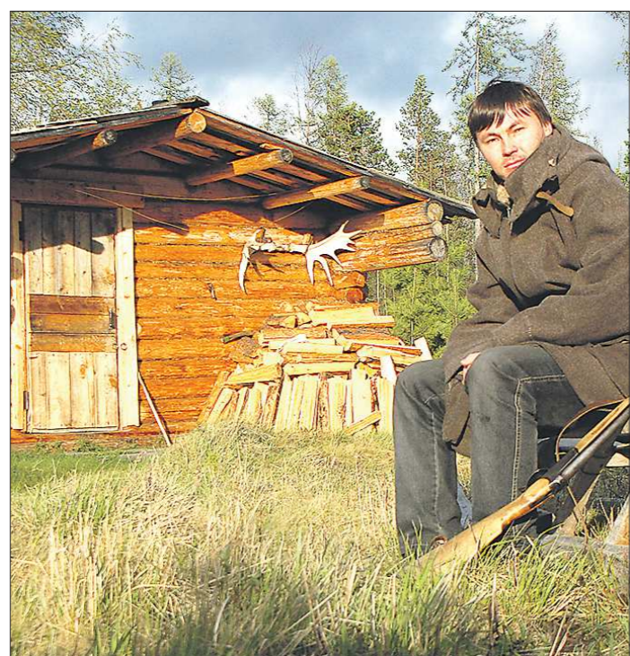
Охота всегда вырвала манси...

– Манси считаются коренным народом Северного Урала, но, к сожалению, народом редким, вымирающим. Если слегка коснуться истории, то стоит отметить, что народ манси сложился приблизительно к X-XI веку нашей эры, и тогда мансийцев на территории нынешнего Ивдельского района было гораздо больше. В наши дни Ивдельский городской округ постановлением Правительства Российской Федерации определен территорией проживания коренного малочисленного народа Севера – манси. На территории округа живут 137 манси, в том числе 64 – в лесных поселениях. В то же время за последние десять лет численность народа сильно сократилась: согласно переписи 2010 года, мансийцев было 250 человек. Стоит отметить, что администрация Ивдельского городского округа борется за сохранение коренного народа: действует программа поддержки манси, дети обу-