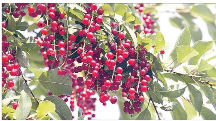
Красная черёмуха красиво смотрится, годится для разных блюд, а ещё отпугивает комаров своим ароматом

В былые времена на чёрной черёмухе ставили и квас. Ягоды кляли медом изюма, но брали их в полтора раза больше: в черёмухе меньше сахара. Перед добавлением ягод в квас нужно опарить кипятком. Вкус у черёмухового кваса не ярко выраженный, зато аромат очень насыщенный. Делают из черёмухи и на-