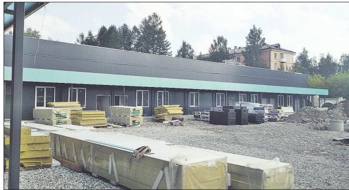
КРАСНОТУРЬИНСКАЯ ГОРОДСКАЯ БОЛЬНИЦА

Корпус строится для пациентов с внебольничной пневмонией: это инфекционное заболевание лёгких часто развивается в период различных эпидемий