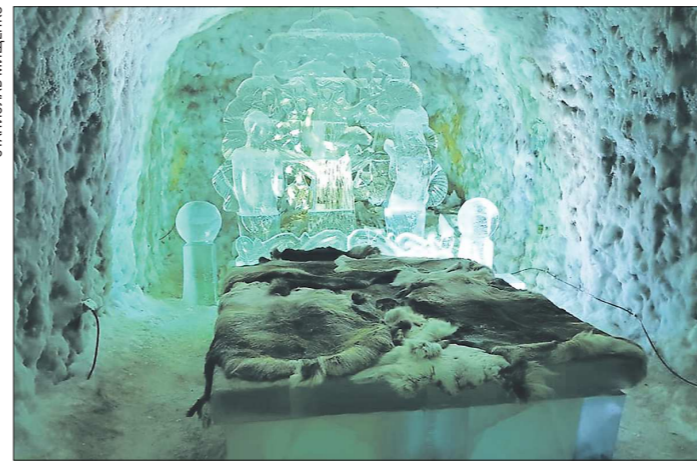
Кровать из льда — одна из достопримечательностей музея «Царство вечной мерзлоты» в окрестностях Якутска

Но сами жители Карелии относятся к своим достопримечательностям без особого восторга: не у многих из них есть деньги, чтобы добраться до местных красот. Билет на теплоход из той же Кемии до Соловков стоит 3 600 рублей на человека туда-обратно, а семисаговая водная экскурсия из Сортавалы до Вала-