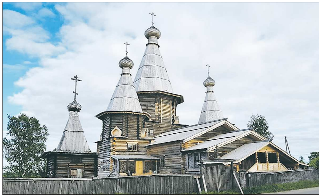
Карелия богата памятниками деревянного зодчества. На фото — Успенский собор в Кемии 1711–1717 годов постройки

В Якутии сосредоточены практически вся таблица Менделеева. Но большинство месторождений хоть и разведаны, но не разрабатываются