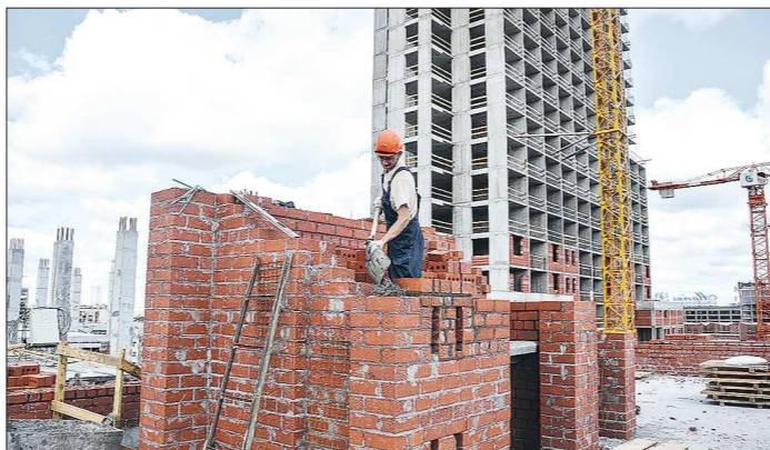
В первом полугодии 2020 года, по данным Свердловскстата, в регионе построили 751,7 тысячи кв. м жилья

В эти выходные Средний Урал отметит День строителя. По традиции, в преддверии праздника отрасль подводит итоги работы за последний год, а компании рассказывают о своих достижениях.