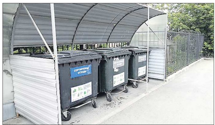
В перспективе дуальный сбор отходов планируется ввести во всех уральских муниципалитетах