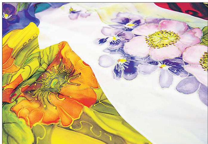
Особенной популярностью, по словам Ольги Вотяковой, пользуются разные цветочные сюжеты на платках