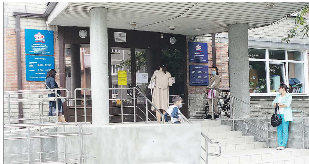
Войти в здание Пенсионного фонда, где расположено офис клиентской службы, сейчас можно только по предварительной записи

В страховой компании «УТМК-медцина» без проблем выдали новый полис медицинского страхования и