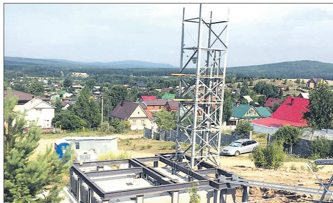
Главная причина возмущений — выбранный земельный участок

Председатель собрания Секретарь собрания