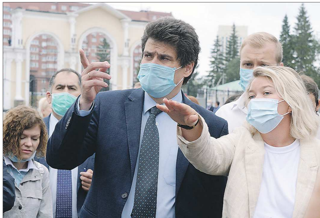
Глава Екатеринбурга Александр Высокинский вместе с директором ЦПКиО Екатеринбургской Кейльман обсудили каждый объект в парке

Кроме моста, в парке к 2021 году откроют кинотеатр под открытым небом — он разместится в здании бывшего Летнего театра. Сейчас это здание находится в аварийном состоянии,