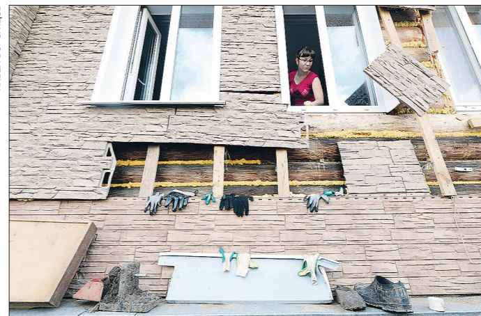
Восстанавливая дома и участки, жители каждый день просушивают рабочую одежду и обувь