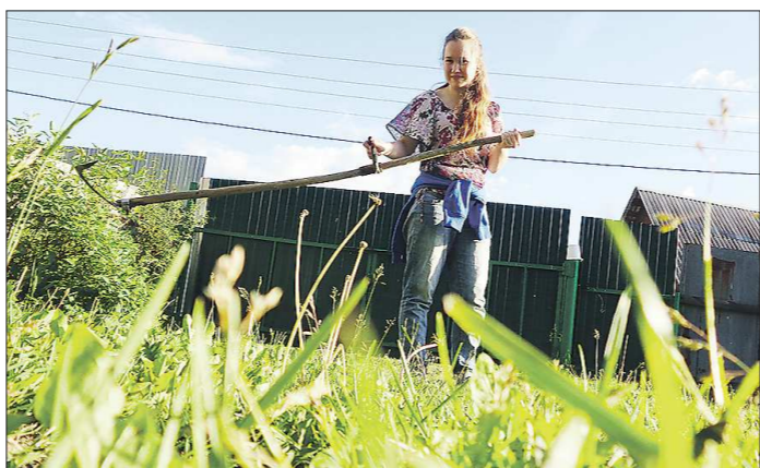
Коса – надёжный и проверенный инструмент для скашивания травы на садовом участке

КОСА. Инструмент древний и достаточно эффективный, особенно, если нет электричества и рельеф на участке не совсем ровный. В продаже сегодня имеются разные варианты косы, и в их эксплуатации есть ряд нюансов. Во-первых, важно правильно подобрать высоту ручки: если поставить косу на пятку, то ручка должна быть на уровне пупка. Если же ручка будет ниже, то косарию придётся работать в наклон, а если выше, то коса будет втыкаться в землю – всё это весьма неудобно. Во-вторых, косу на-