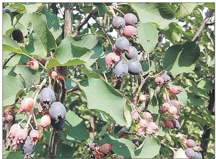
Один из недостатков ирги: её ягоды созревают неравномерно на кусте, поэтому собирать их приходится по несколько раз

– Да, ягода сладкая, на кусту – просто объедение, но уже очень пресная получается в варенье, – говорят некоторые садоводы про иргу и не делают никаких заготовок из неё. В специальной литературе встречаются советы по заморозке ирги. Но когда её разморозишь – одно разочарование, ягода делается безвкусной и теряет весь сахар. У многих после таких попыток сделать заготовки опускаются руки. А если попытаться использовать иргу по-другому?