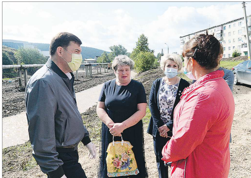
Пользуясь случаем, нижнесергинцы высказали просьбы губернатору, даже не связанные с паводком

Чтобы вернуть реки в русло, восстановить улично-дорожную сеть, построить временные переправы и положить шесть водопропускных труб, потребовалось около 70 млн рублей, рассказал Васи-