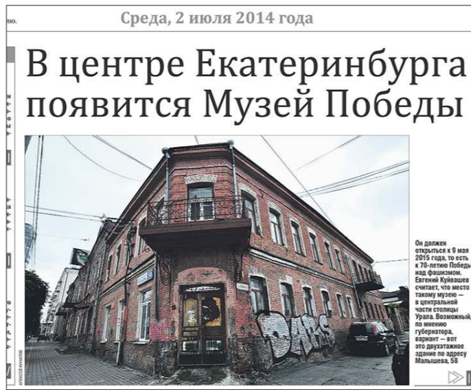
Шесть лет назад «Областная газета» рассказывала о том, что в здании по улице Малышева, 58 предлагалось открыть Музей Победы, но эта идея так и не была реализована. Правда, в Екатеринбурге есть Музей боевой славы Урала в Доме офицеров, а также Музей военной техники и Центральной библиотеки Вооружённых Сил Российской Федерации