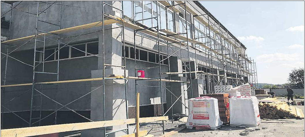
Фасад здания ДК также будет отремонтирован. Рабочие уже установили строительные леса и подготовили необходимый материал

– Есть граждане, которым просто нечем платить. Крупных предпрятий на территории нет, максимальная зарплата – 15–20 тысяч рублей. И оплачивать взносы, особен-