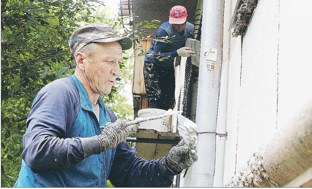
Взносы жителей идут на ремонт фасада и кровли домов, а также внутренних коммунальных сетей

В Верхотурье, Гаях и Красноуральске зафиксирован самый низкий по области уровень собираемости средств с населения на капремонт многоквартирных домов (МКД).