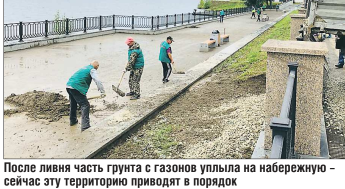
После ливня часть грунта с газонов уплыла на набережную – сейчас эту территорию приводят в порядок

Погода устроила нашим дорожникам экзамен. Ситуация нештатная. Дежурные бригады МУП «Тагилдорстрой» и «УБТ-сервис» устраняют последствия ливня по всему городу.