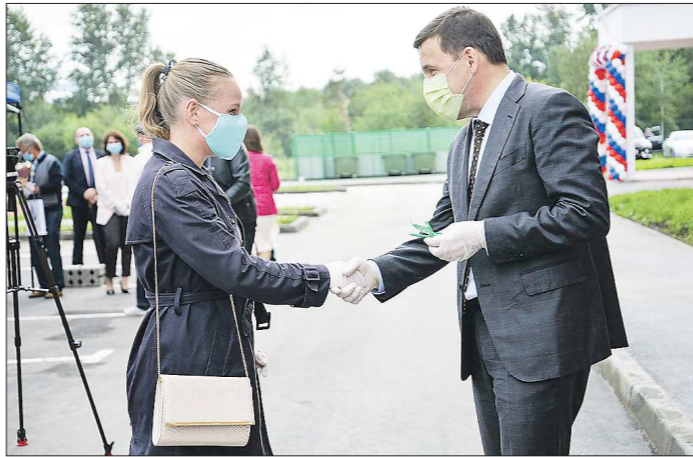
Ключи будущим жильцам «Кольцовского дворика» вручил губернатор Свердловской области Евгений Куйвашев

Тем не менее проблему эту власти Среднего Урала решают достаточно настойчиво и последовательно. Именно у нас ещё в 2011 году был принят региональный закон о поддержке граждан, пострадавших от недобросовестных застройщиков, который послужил примером не только для других субъектов федерации, но и для разработки аналогичного федерального нормативно-правового акта. Тогда же в Свердловской области был составлен ре-