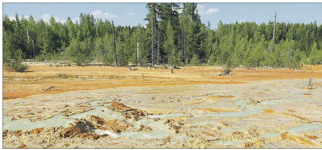
Вот такой космический пейзаж можно увидеть под Лёвихой

Средний Урал по праву гордится богатыми залежами полезных ископаемых, но у горнодобывающей отрасли есть «побочные эффекты». Там, где велась или ведётся горные работы, неизбежно деградируют земельные и техногенные образования: карьеры, отвалы, шламовые пустыни. Марсианские территории под Богдановичем, мёртвые озёра Дегтярская, пески аглофабрик в Качканаре и Кушве... Вся карта нашего региона в таких опасных пятнах. Одно из самых ярких — на месте шахт Лёвихинского медного рудника. Каждый раз после фотографии, попавших в Интернет, мир вздрагивает и говорит об экокатастрофе. Так было в 2015-м, 2018-м и сейчас. Облгазета выяснила, что кроется за оранжевой «обложкой» Лёвихи.