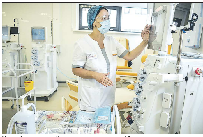
Новый диализный центр рассчитан на 16 мест