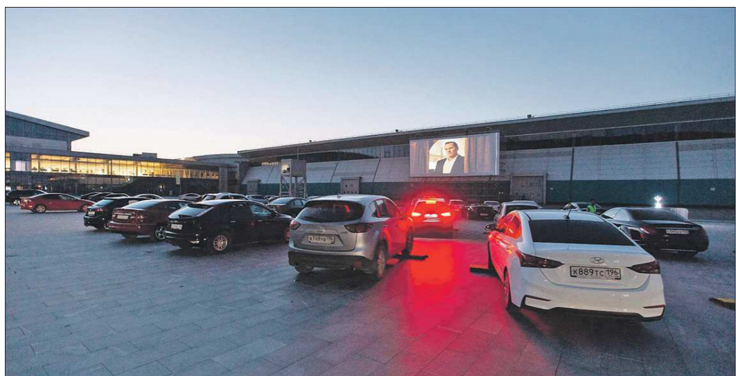
Если будет повышенный спрос, организаторы смогут увеличить число мест в автокинотеатре

Подготовлено в соответствии с критериями, утвержденными приказом Департамента информационной политики Свердловской области от 09.01.2018 №1 «Об утверждении критериев отнесения информационных материалов, публикуемых государственными учреждениями Свердловской области, в отношении которых функции и полномочия учредителя осуществляет Департамент информационной политики Свердловской области, к социально значимой информации».