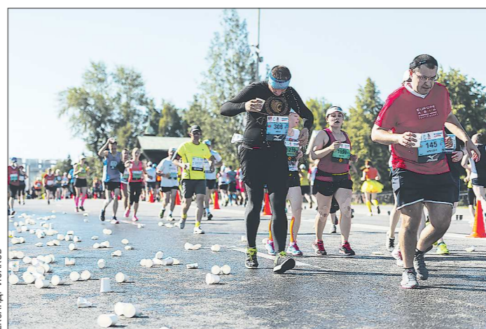
В этом году организаторы откажутся от пластиковых стаканчиков с водой. Одной проблемой, наверное, будет меньше

Напомним, что ещё в июне организаторы отметили, что планируют провести марафон в августе. Тогда же стало известно, что традиционный маршрут претерпит изменения. Так, участники будут стартовать и финишировать на Октябрьской площади, в районе Театра драмы. Дистанция будет следующие: 1 520 метров, 5, 10, 21,1 и 42,2 километра. И, что важно, в этот раз участники не будут добежать до стелы «Европа - Азия». Маршруты будут пролегать в черте города. Сейчас, после распоряжения главы региона, организаторы рассказали, как они будут соблюдать правила безопасности. Они будут применяться как во время старта, так и в момент выдачи стартовых пакетов участникам. Во-первых, обязательно ношение маски при нахождении в стартово-финишном городке и при выдаче пакетов. Во время самого забега (если вдруг об этом кто-то подумал) защитное средство надевать не нужно. Бежать в маске, тем более 42 километра - невозможно.