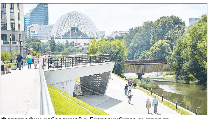
Фотографии набережной в Екатеринбурге выглядят как ожившие картинки из дизайн-проекта

Что же касается упомянутых выше авиаперевозчиков, то они освобождаются от уплаты этого налога только за 2020 год. Такая льгота распространяется на перевозчиков и аэропорты. Кроме того, изменениями предусмотрено снижение налога на имущество на 35 процентов для организаций-собственников объектов деловой и торговой недвижимости, которую они сдают в арен-