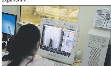
Объединение позволит медицине стать единой с точки зрения ведомственной подчинённости

Согласно документу, муниципальный МИАЦ будет передан в областную собственность с 1 августа. Куратором его деятельности будет региональное министерство здравоохранения.