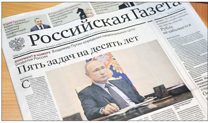
В новом указе особое внимание уделено благополучию людей, развитию талантов, безопасности, эффективному труду и предпринимательству, цифровой трансформации

Президент России Владимир Путин подписал 21 июля указ «О национальных целях развития Российской Федерации на период до 2030 года». Он корректирует майский указ 2018 года. Несмотря на то, что достижение запланированных ранее показателей по улучшению благосостояния россиян отложено на шесть лет, планы всё равно серьезные.