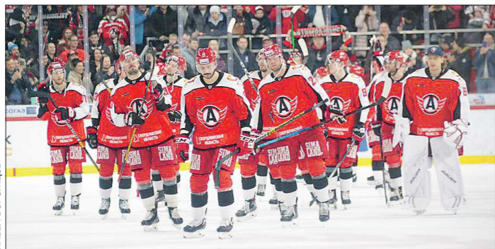
В новом сезоне клубам КХЛ придётся играть при ограниченном количестве зрителей

Старт нового сезона в Континентальной хоккейной лиге произойдёт в начале сентября. Команды постепенно выходят из отпуска, проходят медицинские обследования и отправляются на сборы. Однако предстоящий сезон обещает быть особенным, и, к сожалению, не в самом хорошем значении этого слова.