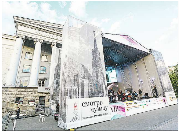
Фестиваль традиционно пройдёт на площади перед главным корпусом УрФУ