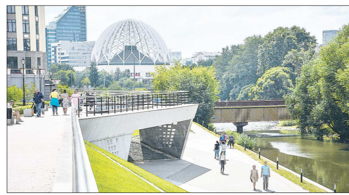
Фотографии набережной в Екатеринбурге выглядят как ожившие картинки из дизайн-проекта

Помимо этого, расширен перечень отраслей, наиболее пострадавших от коронавирусной инфекции. Перечень пополнен десятью видами деятельности, среди которых печатание газет, издание книг, журналов, деятельность в области телевизионного и радиовещания. Таким образом, пониженная ставка в размере 1,1 процента по налогу на имущество будет действовать в Свердловской области в отношении 47 видов экономической деятельности.