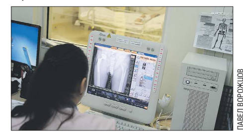
Объединение позволит медицине стать единой с точки зрения ведомственной подчинённости

В регионе создаётся единая эффективная цифровая система здравоохранения. В результате этого медицинский информационно-аналитический центр (МИАЦ) Екатеринбург будет встроены в информационную систему Свердловской области. Постановление об этом приняло правительство области на своём вчерашнем заседании. Согласно документу, муниципальный МИАЦ будет передан в областную собственность с 1 августа. Куратором его деятельности будет региональное министерство здравоохранения.