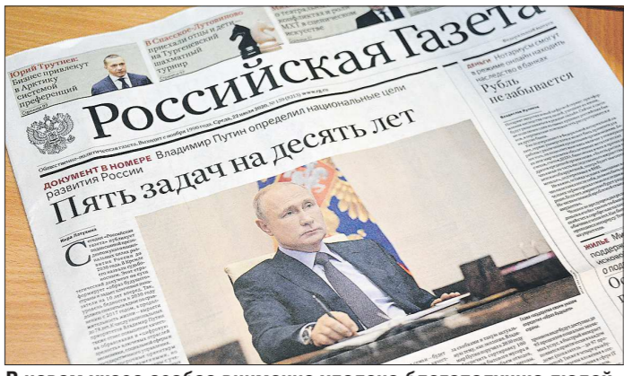
В новом указе особое внимание уделено благополучию людей, развитию талантов, безопасности, эффективному труду и предпринимательству, цифровой трансформации

Президент России Владимир Путин подписал 21 июля Указ «О национальных целях развития Российской Федерации на период до 2030 года». Он корректирует майский указ 2018 года. Несмотря на то, что достижение запланированных ранее показателей по улучшению благосостояния россиян отложено на шесть лет, планы всё равно серьезные.