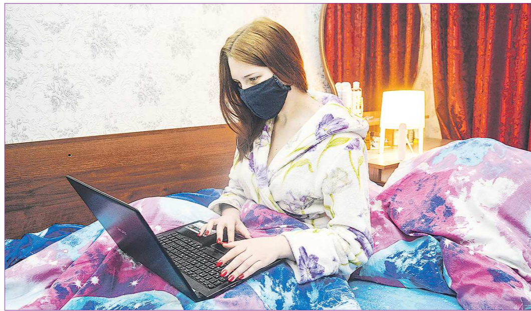
Многим компаниям в период распространения инфекции удалось наладить работу и подбор персонала в удалённом режиме. Даже после снятия ограничений они не собираются отказываться от приобретённого формата работы

Единственное, что не смогли учесть в своих прогнозах экономисты, так это то, что появятся существенные меры поддержки государством людей, потерявших работу, и это также скажется на росте численности безработных. Сегодня в центры занятости потянулись те, кто годами не работал. Возможно, в нарушение закона за пособием обратились даже те, кто получают