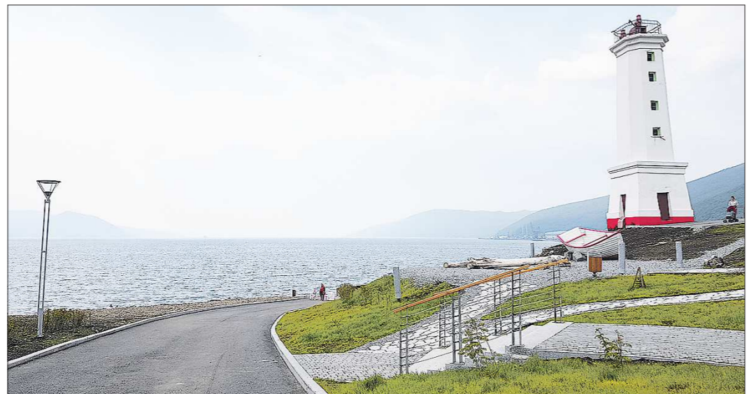
Одним из первых дел Носова в должности губернатора стала реконструкция набережной в Магадане

Как живётся в других регионах России? Корреспондент «Область» посетил несколько областей в западной и восточной частях страны и узнал, что волнует местных жителей. В Архангельске люди жалуются властям на ветхое жильё, а в Магадане, наоборот, благодарят их за новую набережную вдоль берега Охотского моря.