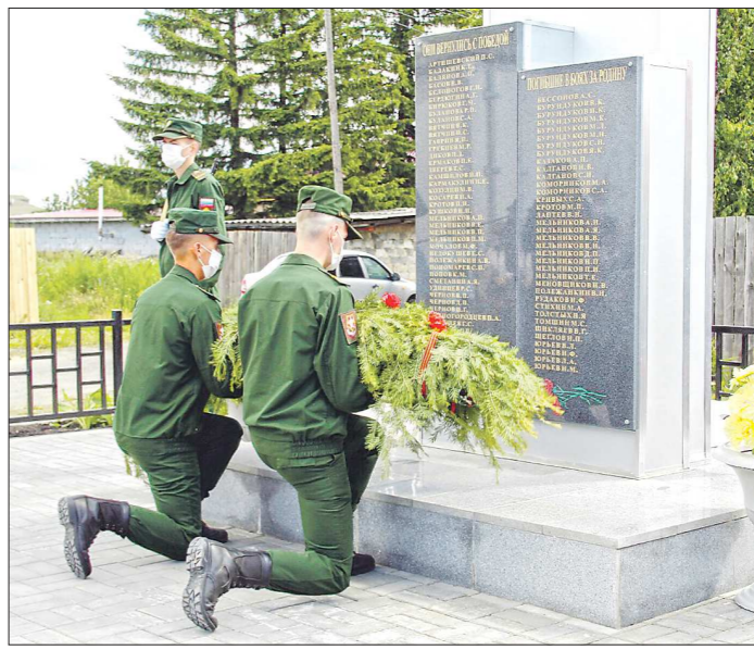
К отреставрированному обелиску в деревне Мельникова ирбитчане возложили цветы

У обелисков подрядчики убирают ветхие деревья и кустарники, демонтируют старые асфальтовые дорожки и ограждения, снимают выцветшие гранитные плиты и таблички с именами солдат. Взамен укладывают новый асфальт, каркас обелисков укрепляют (а в некоторых случаях полностью меняют), облицовывают надгробия гранитными плитами,