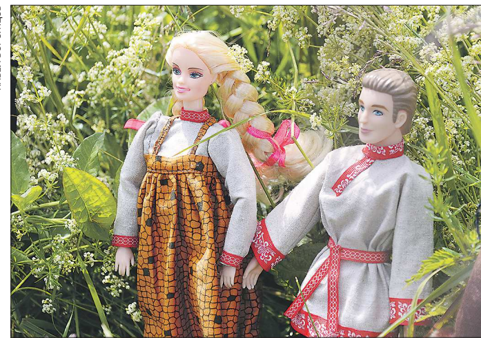
Летняя повседневная одежда в Полднево

Оно появилось на одной из речек, питавших Чусовую, как крепость для защиты от набегов башкир на Полевскую и Серверский заводы. Потом здесь поселились бывшие работники этих заводов – занимались в основном старательством: недалеко от села – рудники Камского «Серебряного копья». В окрестностях его, на отрогах Уральских гор, и сейчас ещё находят золото и хризолиты. А два столетия назад