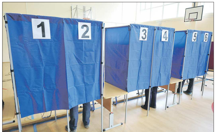
Пока не понятно, будут ли на участках соблюдаться особые меры защиты, как это было на голосовании по Конституции. Всё будет зависеть от эпидемической обстановки

Важно отметить, что кандидатам-самовыдвиженцам и кандидатам от партий, у которых нет предпочтений при регистрации, нужно соби-