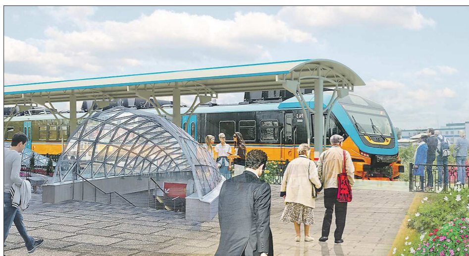
Вариант остановочного комплекса в Сысерти