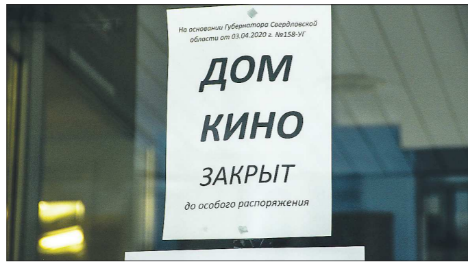
Кинотеатры региона ждут особого распоряжения от властей

Министр культуры Российской Федерации Ольга Любимова подписала приказ «О рекомендациях организациям, осуществляющим публичную демонстрацию фильмов (кинотеатрам)».