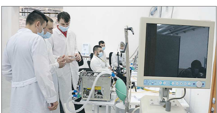
В ходе пандемии Уральский приборостроительный завод многократно увеличил производство аппаратов ИВЛ

– После инцидентов с пожарами в Москве и Санкт-Петербурге мы создали спецкомиссию для дополнительного технического исследования аппаратов ИВЛ «Авента-М».