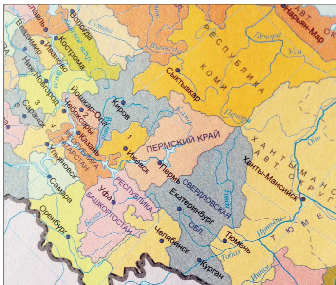
Двигателем создания подобных межрегиональных объединений должно стать развитие транспортной инфраструктуры

Председатель Счётной палаты РФ Алексей Кудрин выступил с инициативой объединить три города-миллионника – Екатеринбург, Челябинск и Пермь в одну крупную агломерацию.