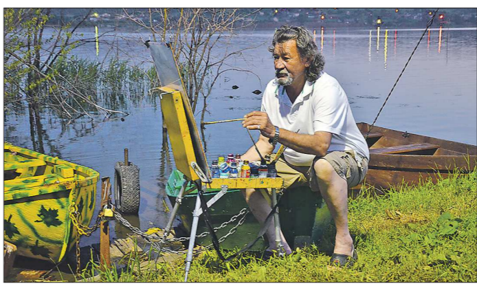
У каждого творца свой индивидуальный взгляд

— Вы уже отметили, что «основная задача нашей общероссийской организации — развитие биатлона в стране, а не сборная команда». Какое внимание сейчас в первую очередь будет уделяться сборной России? Или же, наоборот, сейчас необходимо решать вопросы с регионами?