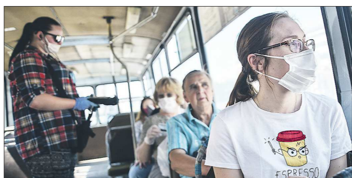
Проверки в транспорте проходят регулярно, но «безмасочных» пассажиров всё равно хватает