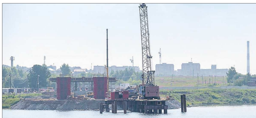
Ещё в прошлом году находились сомневающиеся в том, что тагильский мост будет построен. А нынче у проекта появились реальные очертания

Прошлый год можно назвать прорывным в создании условий для качканарских спортсменов. Были сданы два крупных объекта капитального строительства: физкультурно-спортивный комплекс «Олимп» и