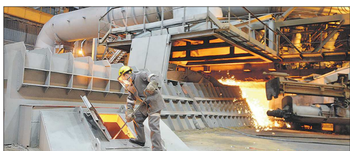
Модернизация даст возможность предприятию выпускать чугун уже на двух новых современных домахх