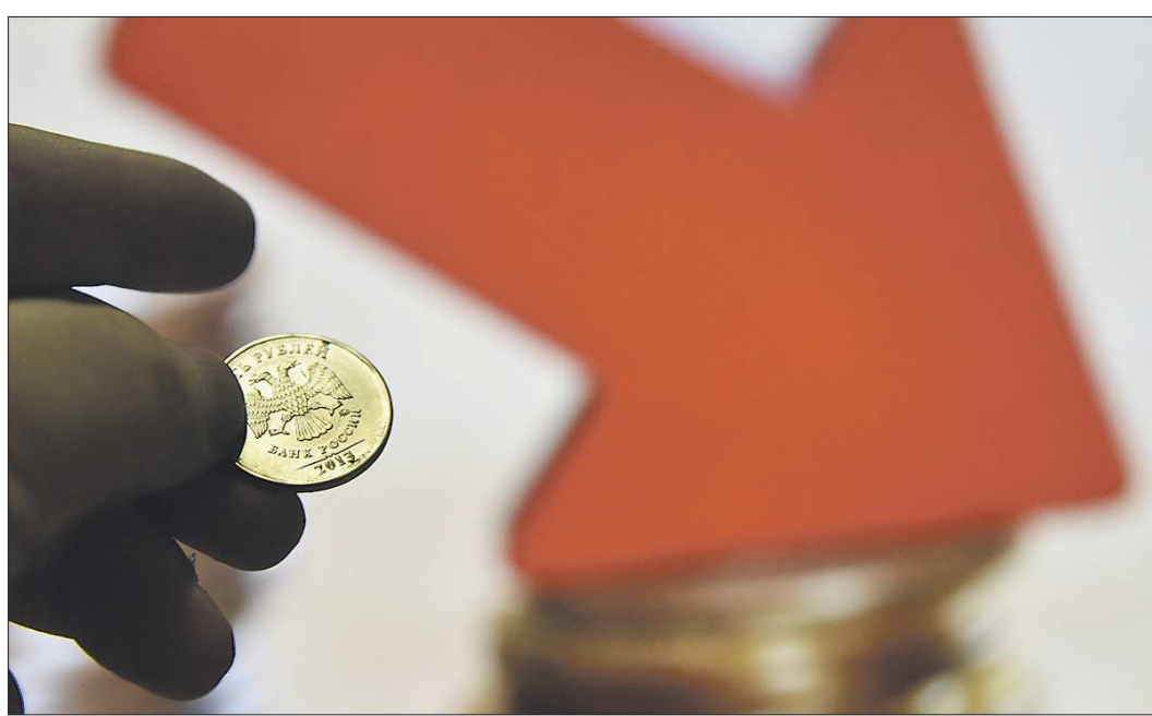
Если бы деноминация произошла, то булка хлеба могла бы стоить не 35 рублей, а 35 копеек. Но и зарплата у граждан сократилась бы

Подготовлено в соответствии с критериями, утверждёнными приказом Департамента информационной политики Свердловской области от 09.01.2018 №1 «Об утверждении критериев отнесения информационных материалов, публикуемых государственными учреждениями Свердловской области, в отношении которых функции и полномочия учредителя осуществляет Департамент информационной политики Свердловской области, к социально значимой информации».