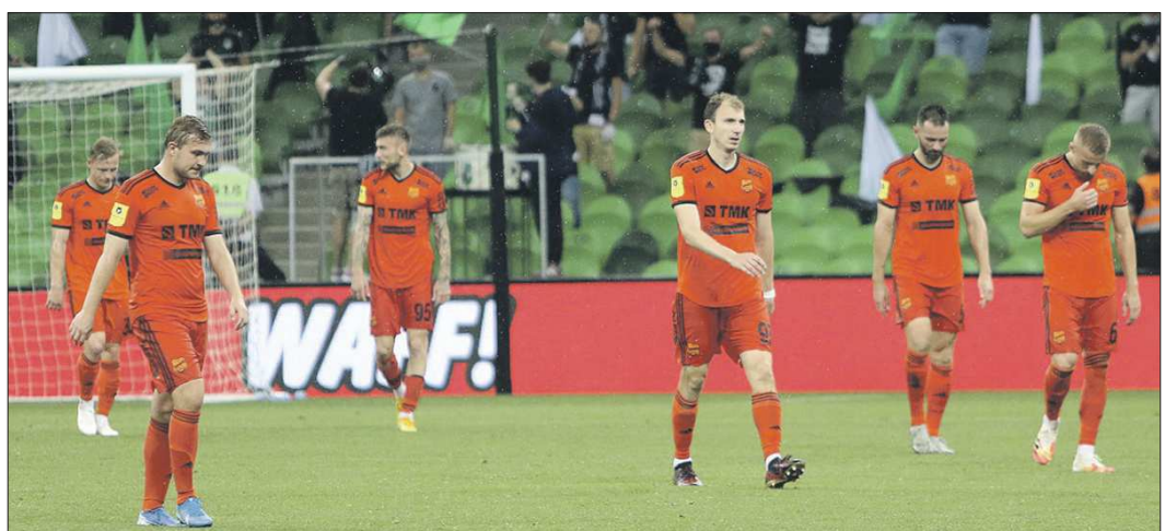
За два тура до конца чемпионата «Урал» занимает восьмое место в турнирной таблице

А в главном бою турнира сошлись среднеясы: Камару Усман и Хорхе Масвидаль . Интересно, что Усман должен был защищать свой чемпионский пояс в поединке с Гилбертом Бернсом , однако у бразильца диагностировали коронавирус. На замену согласился выйти Масвидаль, хотя времени на подготовку к бою у него практически не было: Хорхе подписал контракт на шестидневном уведомлении. Несмотря на это, поединок прошёл все пять раундов. Многие фанаты назвали бой скучным, Усман одержал победу единогласным решением судей и во второй раз защитил титул чемпиона UFC.