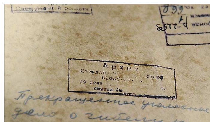
Уголовное дело о гибели дятловцев хранилось в региональной прокуратуре до 1974 года, затем его передали в Государственный архив Свердловской области