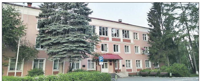
За политической обстановкой в городской думе «ОГ» следит не первый год