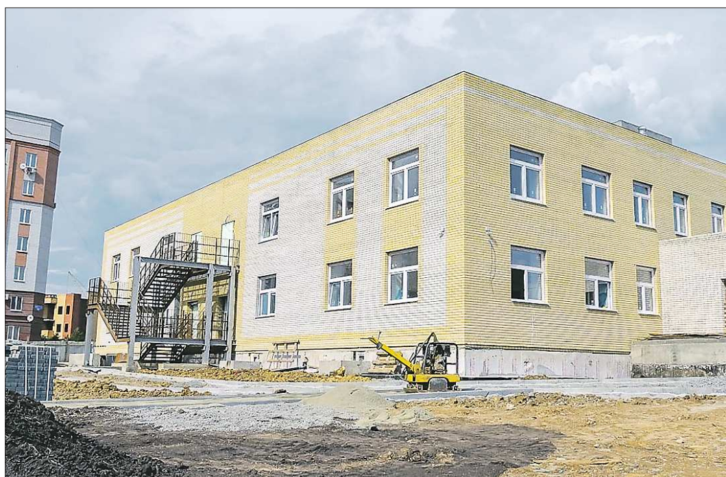
Новый детсад примет воспитанников, как только в Нижнем Тагиле снимут ограничения работы дошкольных учреждений

Подготовлено в соответствии с критериями, утвержденными приказом Департамента информационной политики Свердловской области от 09.01.2018 №1 «Об утверждении критериев отнесения информационных материалов, публикуемых государственными учреждениями Свердловской области, в отношении которых функции и полномочия учредителя осуществляет Департамент информационной политики Свердловской области, к социально значимой информации».