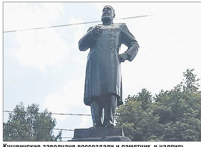
Кушвинские заводчане воссоздали и памятник, и надпись на постаменте

— Городу и нашему заводу исполняется 285 лет. К этой дате мы решили сделать подарок себе и всем кушвинцам — восстановить памятник Александру III, основыва-