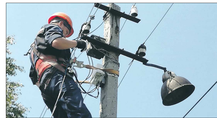
Умные счётчики монтируются на негизифицированных улицах Покровского

Прямо скажу, относилась к ежемесячной передаче показаний безалаберно. Закрутились и пропустишь дни приёма. Прошлым летом нам смонтировали умный счётчик. Он передаёт показания сам. Мне счётчик понравился, а вот соседям – вряд ли. У них раньше электроты были в доме, гараже и теплице. А нынче в холодном июне