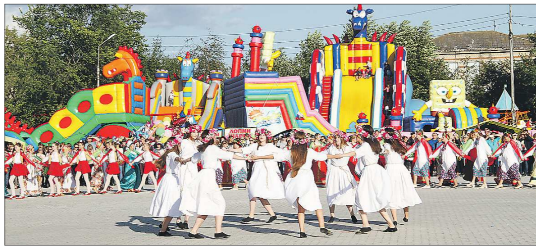
ФАБЕЯ - ЗНАМЯ ПОБЕДЫ

● Нижней Салде в июле исполняется 260 лет. Как сообщили «Областной газете» в местной администрации, для жителей пройдут праздничные онлайн-концерты ко Дню города. Трансляцию можно будет посмотреть на сайтах городского округа и местного Дворца культуры. Первые лица муниципалитета также поздравят горожан онлайн. А вот награждать жителей почётными грамотами и благодарственными письмами будут лично — на торжественных собраниях, которые пройдут в организациях города. Соблюдение социальной дистанции и наличие маски — обязательны.