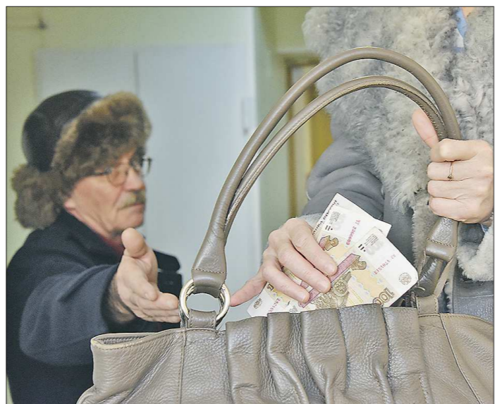
Забирать последние деньги на уплату кредитов у пенсионеров больше не будут. Теперь они могут выплачивать долг комфортными платежами

Впрочем, рассрочка доступна только тем заемщикам, размер пенсий которых не превышает двух МРОТ — это 24 260 рублей. Никаких иных источников дохода, кроме пенсии, у адресата льготы быть не должно. Кроме того, рассрочка предоставляется только по тем кредитам, которые не превышают одного млн рублей.