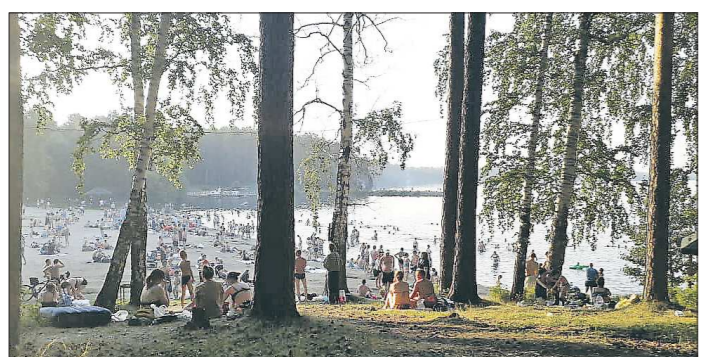
Пляж на озере Балтым очень плотно заполнен отдыхающими вопреки правилам