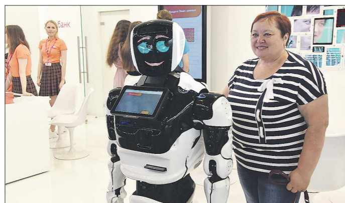
Посетители ИННОПРОМа всегда обращали внимание на роботов и с удовольствием фотографировались с ними. Во время пандемии оказалось, что заменить человека мыслящей машиной не только выгоднее, но и безопаснее