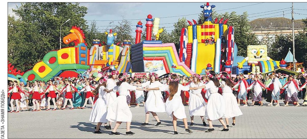
ФАБЕЯ - ЗНАМЯ ПОБЕДЫ

● Рабочий посёлок Бисерть 25 июля отмечает своё 285-летие. — 18 июля у нас состоится марафон, приуроченный к празднику — он согласован с областным министерством физической культуры и спорта.