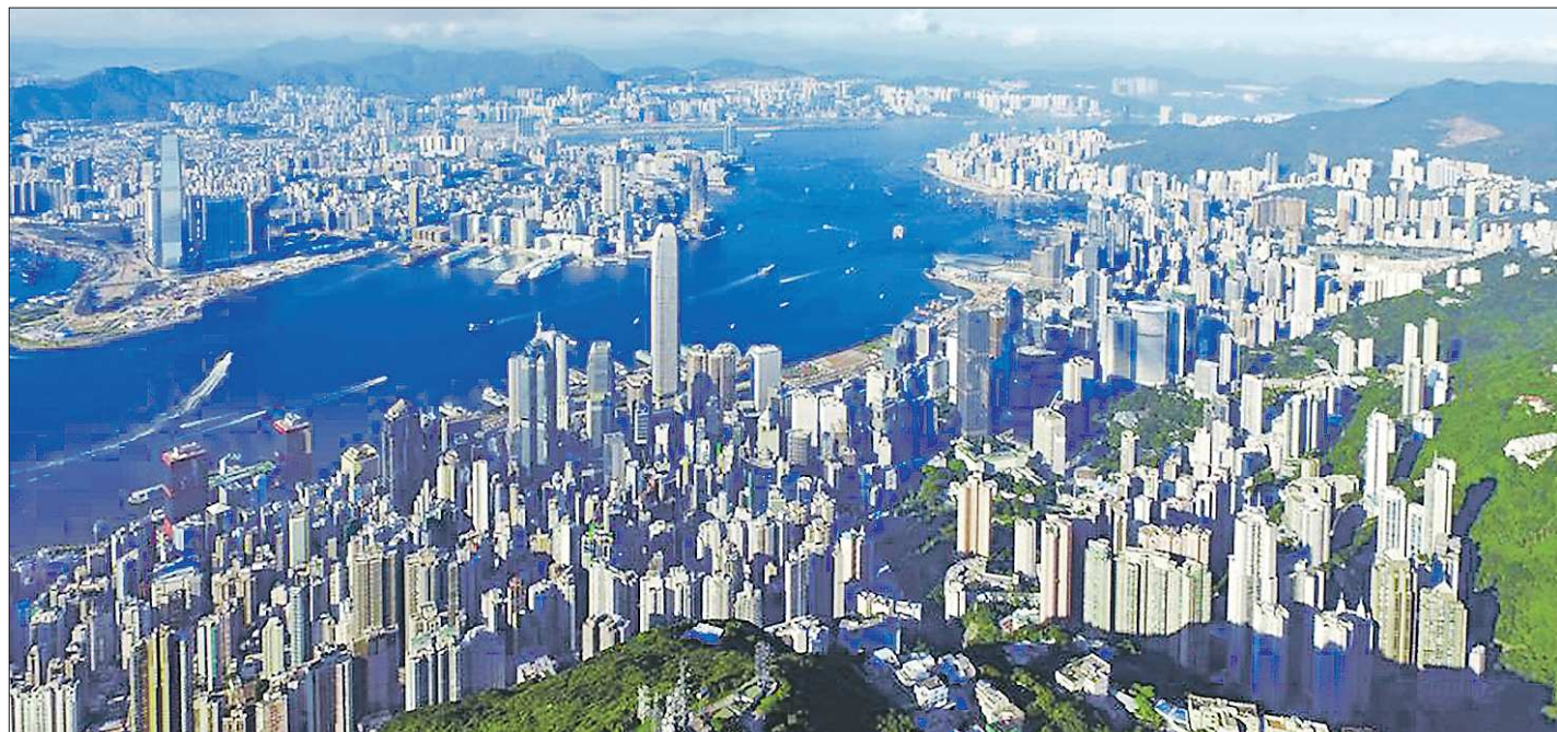
Специальный административный район Сянган располагается на южном побережье Китая на живописных островах, самым крупным из которых является остров Гонконг

ПРЕДВРАЩЕНИЕ УРОЗ. Согласно документу, для выполнения своих обязанностей центральной власти является абстрактной, а включает в себя законодательные, правоохранительные, судебные и административные полномочия, и Китай в целом не является исключением. Следующим, можно сказать, что все преступления, ставящие под угрозу национальную безопасность в САР Сянган, дают право центральному правительству на прямую юрисдикцию. Далее по закону в юрисдикцию Управления по обеспечению национальной безопасности в САР Сянган входят лишь четыре категории преступлений: сепаратизм, подрыв государственной вла-