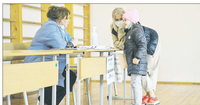
Несмотря на то, что на большинстве участков не было музыки и шаров, там всё равно царил позитивная атмосфера