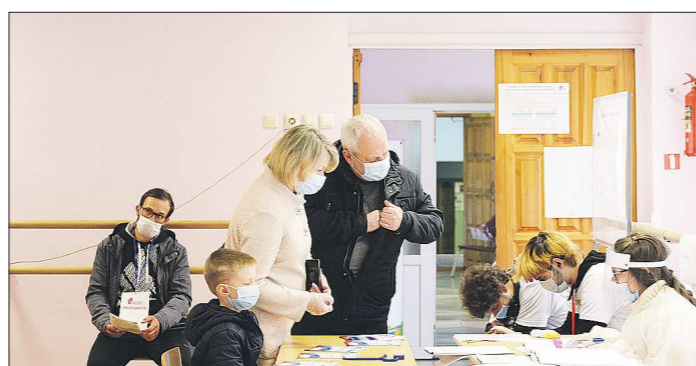
Голосовать за поправки уральцы приходили целыми семьями

Подготовлено в соответствии с критериями, утвержденными приказом Департамента информационной политики Свердловской области от 09.01.2018 №1 «Об утверждении критериев отнесения информационных материалов, публикуемых государственными учреждениями Свердловской области, в отношении которых функции и полномочия учредителя осуществляет Департамент информационной политики Свердловской области, к социально значимой информации».