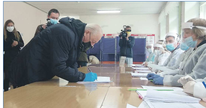
Эдуард Россель уже 25 лет голосует в Малом Истоке

Подготовлено в соответствии с критериями, утвержденными приказом Департамента информационной политики Свердловской области от 09.01.2018 №1 «Об утверждении критериев отнесения информационных материалов, публикуемых государственными учреждениями Свердловской области, в отношении которых функции и полномочия учредителя осуществляет Департамент информационной политики Свердловской области, к социально значимой информации».