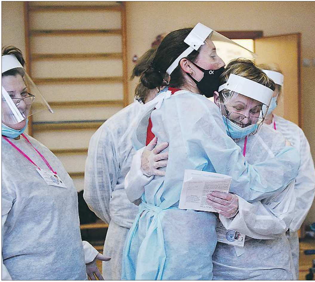
После окончания голосования члены избирательных комиссий не скрывали чувства

Среди тех, кто проголосовал 1 июля, – первый губернатор Свердловской области и член Совета Федерации Эдуард Россель. Утром он вместе с супругой Аудой Александров-