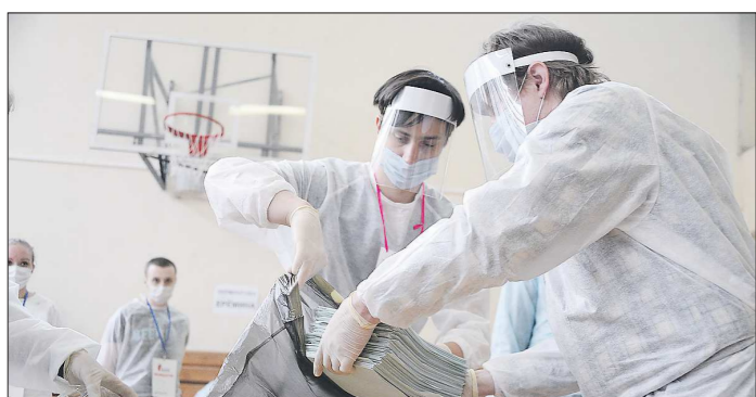
После закрытия участков комиссия приступила к подсчёту бюллетеней