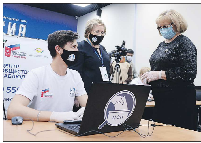
Председатель Законодательного собрания Людмила Бабушкина – традиционный гость в Центре общественного наблюдения

ступила жалоба с участка на Севастопольской, 1. Избиратели сообщили, что на участке нарушается тайна голосования: кабинки отсутствуют, а члены избирательной комиссии заставляют заполнить бюллетень прямо перед собой. Разобраться в ситуации приехали зампреда Общественной палаты Свердловской области Вадим Савин и региональный координатор ассоциации «Независимый общественный мониторинг» Дмитрий Быков.