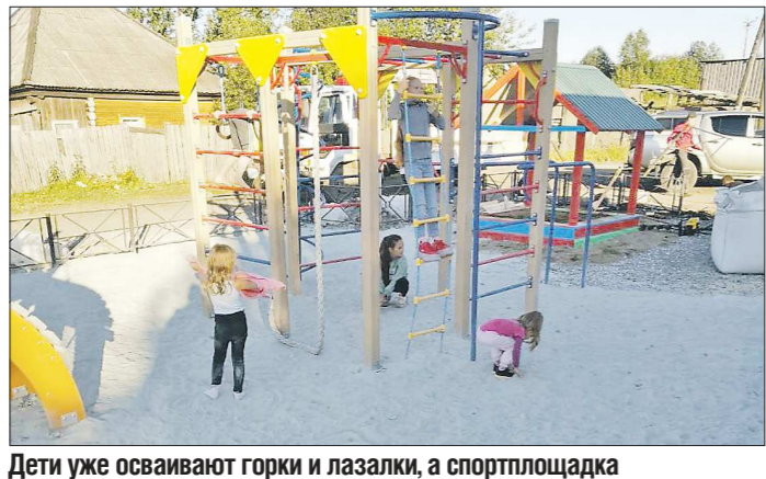
Дети уже осваивают горки и лазалки, а спортплощадка ещё строится