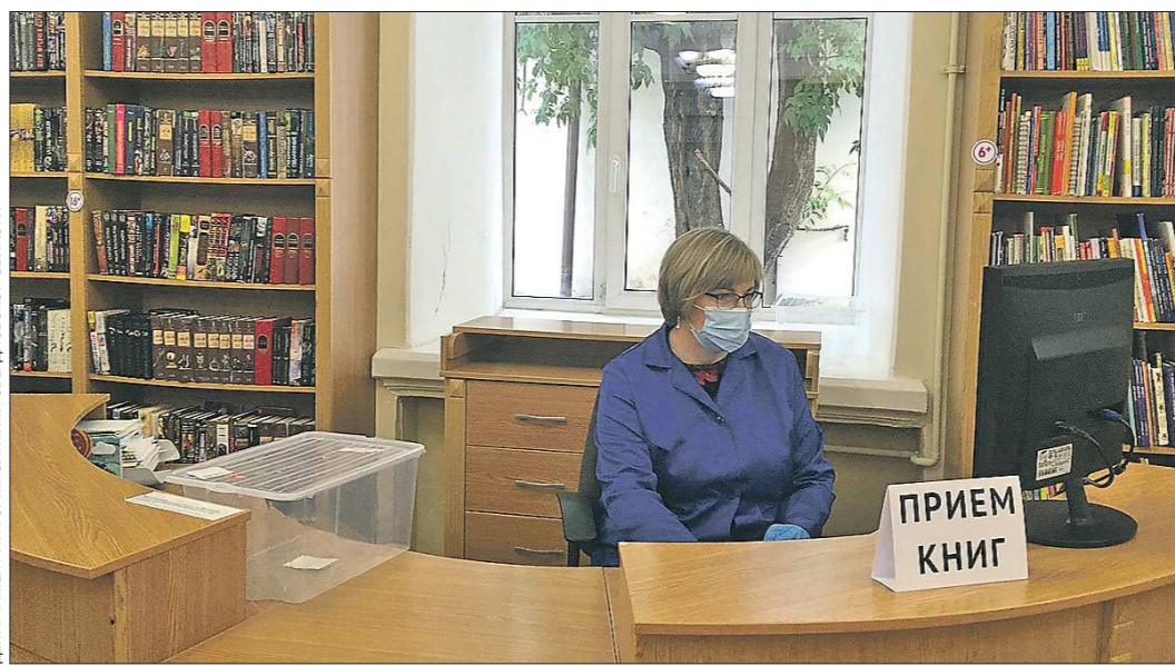
Новая реальность в библиотеках. Маска, перчатки и контейнер (слева), где книга будет находиться пять дней на карантине

Библиотеки Свердловской области были закрыты в марте. Спустя практически три месяца, они стали первыми учреждениями культуры в регионе, которым разрешили принимать посетителей.