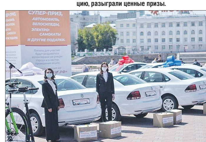
Участники голосования могли выиграть ценные призы

В Екатеринбурге подвели итоги акции «Строим будущее». Среди горожан, принявших участие в голосовании по поправкам в Конституцию, разыграли ценные призы.