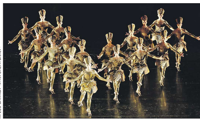
ПРЕСС-СЛУЖБА «УРАЛ ОПЕРА БАЛЕТ»

Номинанты на «Золотую маску» 2019/2020 традиционно были объявлены в конце октября. Затем с января по середине апреля должны были состояться конкурсные показы, и победителей бы назвали 15 апреля.