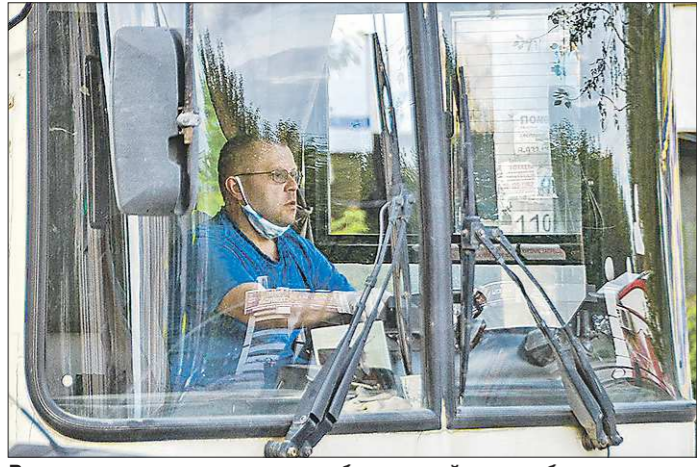
Все новые маршруты по просьбе жителей округа будут следовать до районной больницы