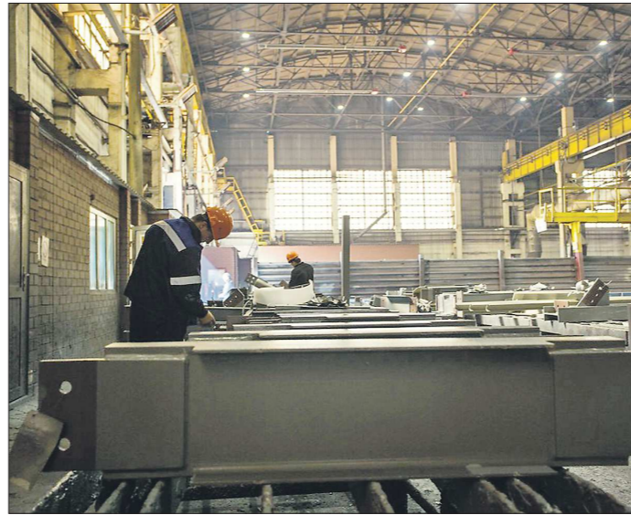
870 работников завода в июле работают три дня в неделю

Нижний Тагил живёт строительством моста, который соединит два берега городского пруда. Поэтому так близко к сердцу приняли горожане обиду работников Нижнетагильского завода металлоконструкций (НТЗМК). Они хотели принять участие в строительстве, но генеральный подрядчик выбрал другую фирму. Масла в огонь возмущения подлило известие о переходе НТЗМК с 1 июля на трёхдневную рабочую неделю.