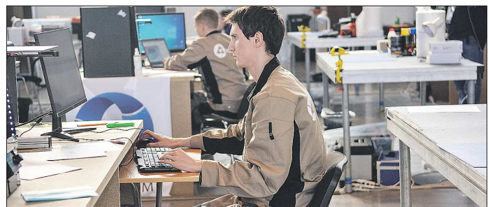
Для того чтобы дорасти до высокой зарплаты по специальности, нужно несколько лет. Далеко не все молодые люди готовы ждать