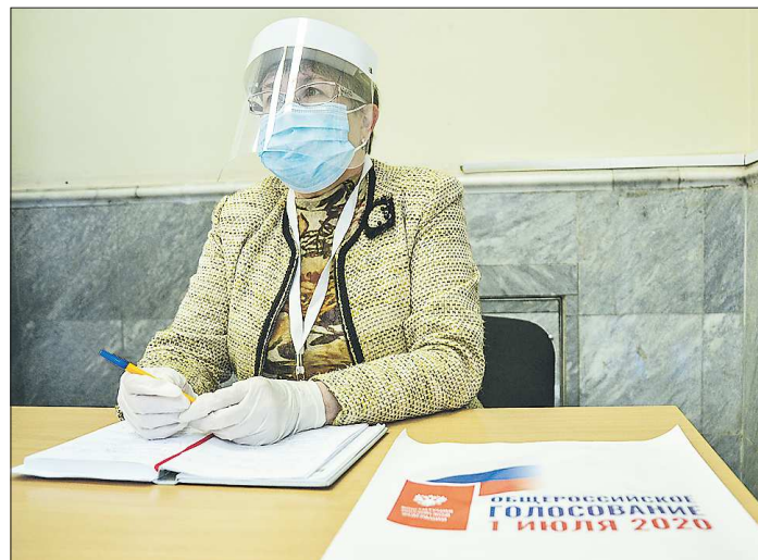
На участках соблюдаются необходимые меры безопасности: члены избирательных комиссий, волонтеры и голосующие в помещении находятся в масках