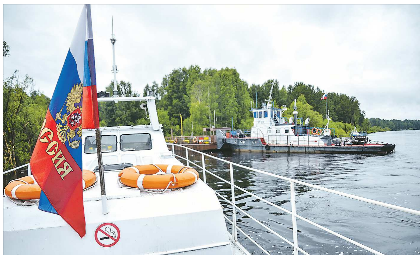
В прошлые выходные в деревне Унже-Павинской Таборинского района прошло голосование по поправкам в Конституцию. По этому поводу в отдалённую деревню, куда можно добраться только на катере, наведались журналисты «Областной газеты». Чем живёт Унже-Павинская и о чём мечтает местное население – в нашем репортаже

На ком и на чём держится жизнь таборинской деревни, отрезанной от большой земли?