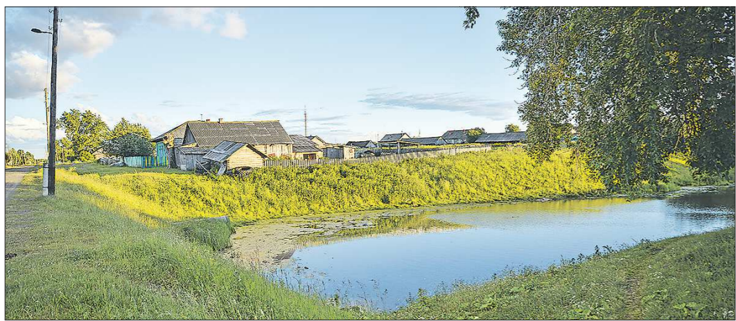
В деревню иногда приезжают туристы - полюбоваться местными красотами

Подготовлено в соответствии с критериями, утверждёнными приказом Департамента информационной политики Свердловской области от 09.01.2018 №1 «Об утверждении критериев отнесения информационных материалов, публикуемых государственными учреждениями Свердловской области, в отношении которых функция и полномочия уполномоченного Департамента информационной политики Свердловской области, к социально значимой информации».