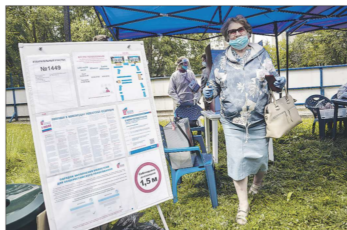
В Свердловской области явка за первый день голосования составила 6,34 процента – своё мнение по поправкам выразили 211 084 участника

Подготовлено в соответствии с критериями, утвержденными приказом Департамента информационной политики Свердловской области от 09.01.2018 №1 «Об утверждении критериев отнесения информационных материалов, публикуемых государственными учреждениями Свердловской области, в отношении которых функции и полномочия учредителя осуществляет Департамент информационной политики Свердловской области, к социально значимой информации».