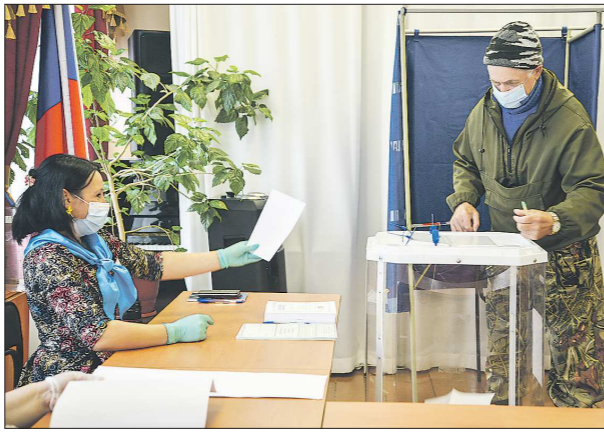
Жители Унже-Павинского голосовали по поправкам в Конституцию 21 июня.