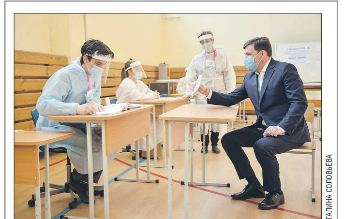
Губернатор прибыл на участок в маске и перчатках

Полный текст обращения опубликован на сайте kremlin.ru .