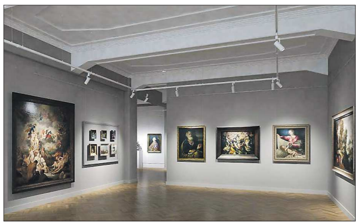
Посетители центра «Эрмитаж-Урал» смогут познакомиться с разными периодами развития европейского искусства (от античности до начала XX века) от итальянских, фламандских, голландских, немецких, французских и английских мастеров