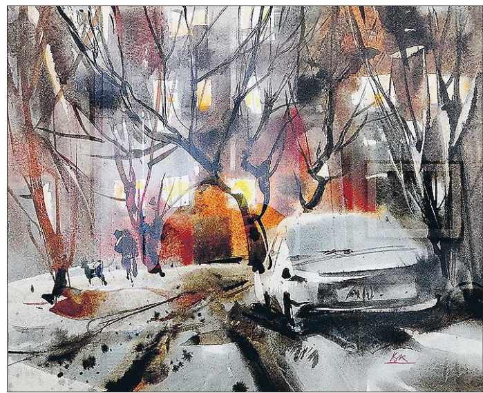
В каталог войдут работы художника последних лет