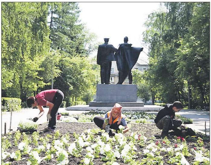
Белые петунии украшают аллею в парке Победы в Ревде