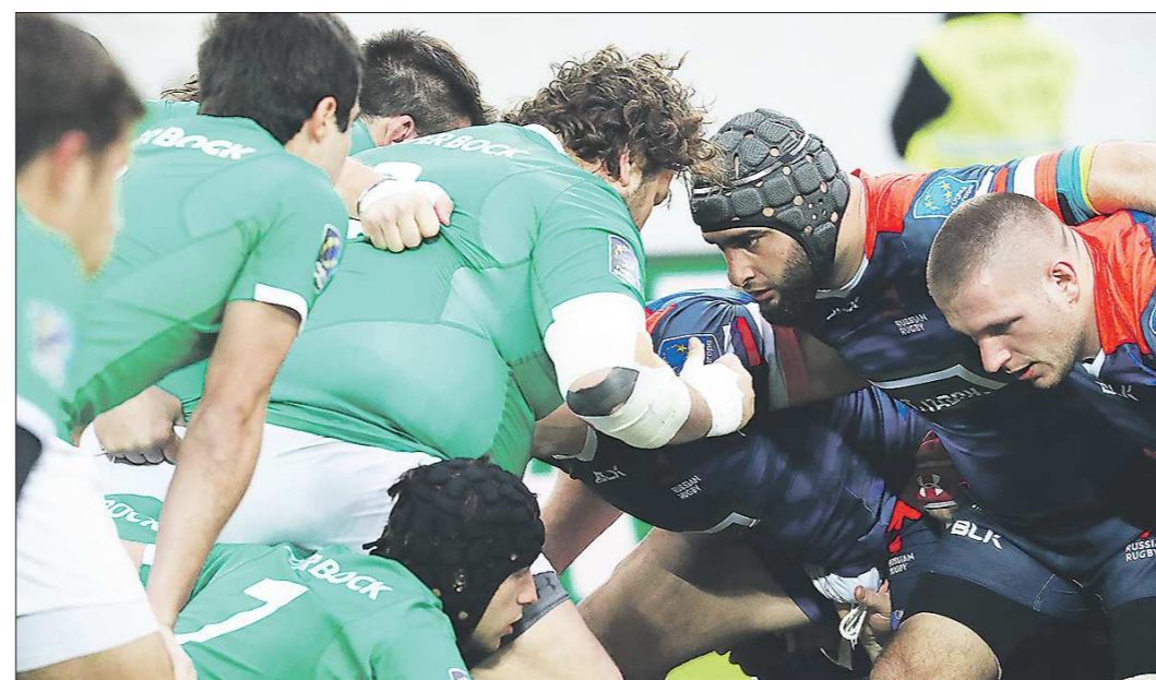
Игроки сборной России по регби (справа) в матче чемпионата Европы с командой Португалии

Вообще-то мы начали реализацию программы по внедрению регби в школьную программу с появлением третьего урока физкультуры, – расска-