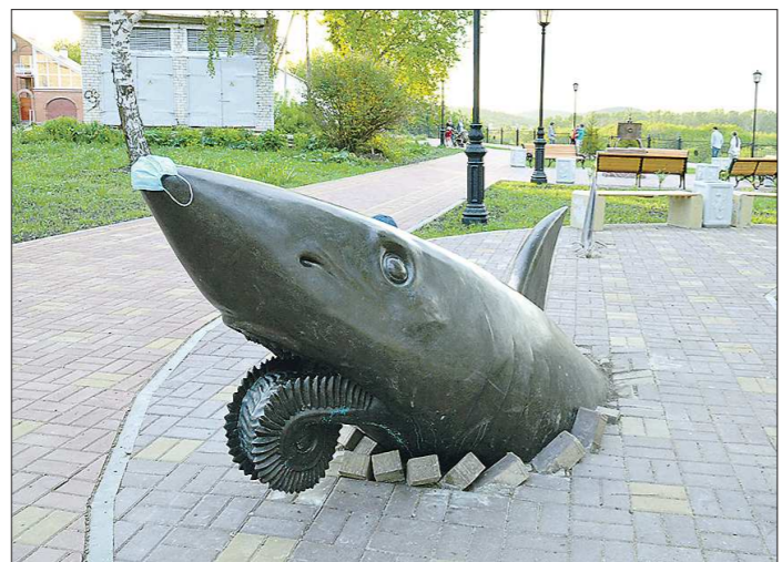
Во время пандемии на акулу заботливо надели масочку. Фигура расположена в благоустроенной части набережной

Как сообщили «Облгазете» в местной администрации, масштабные перемены набережной начались ещё в прошлом году. Контракт был заключён со строительной компанией «Березит». В рамках первого этапа рабочие занимались благоустройством самой набережной – там появились зоны отдыха, спуск к реке, площадка для занятий спортом, были высажены растения. Преобразившуюся территорию сразу же облюбовали горожане. Особой по-