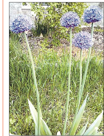
Прекрасно расцвёл у нашей читательницы и декоративный лук