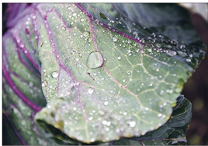
Капусту в это время года нужно регулярно поливать