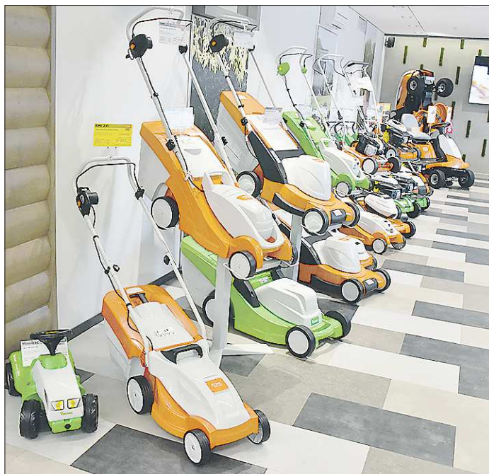
Выбор газонокосилок сегодня очень широк: на любой кошелек и самые разные задачи

Если вы задумались о покупке газонокосилки, значит, вас волнует не просто проблема скашивания травы на участке, а создание красивой зелёной лужайки. И инструмент для этих целей весьма важен. Тем более что выбрать есть из чего: газонокосилки могут быть как бензиновые, так и с электродвигателем, с приводом на колёса и без него, мульчирующие и с травосборником. Есть даже роботы-газонокосилки.