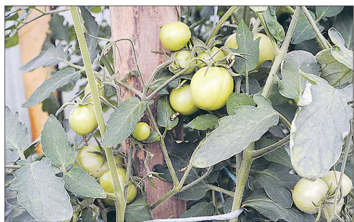
Важно вовремя пасынковать помидоры, иначе все силы растения уйдут не в плоды, а в зелень, и урожая придётся ждать долго

Эксперты говорят однозначное «да» в такой ситуации. — С непасынкующимися томатыми, на которых вырастают новые побеги, садоводы сталкиваются периодически: к сожалению, от обмана недобросовестными производителями не застрахован никто, — говорит проректор по научной работе и инновациям заведующий кафедрой овоще-