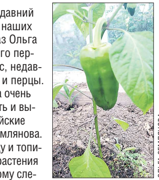
Перцы стали уже размером с ладошку

Помимо этого, на огороде Ольги Земляновой в этом году радуют глаз разные цветы, декоративный лук и даже необычная калина, очень похожая на декоративный вьюн. Читательница вместе со своими домочадцами ждёт, как поведёт себя эта декоративная калина дальше, а главное — будут ли на ней ягоды.