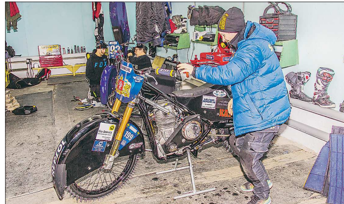
Пока под гараж пришлось приспособить обычный спортзал

Затянувшаяся на несколько лет эпопея с реконструкцией стадиона по техническим видам спорта «Металлург» в Каменске-Уральском наконец-то сдвинулась с мёртвой точки. Соотстоялись электронные торги, победителем которых стала компания «Стройкомплекс» из Нижнего Тагила. Она построит на стадионе модульный гараж.